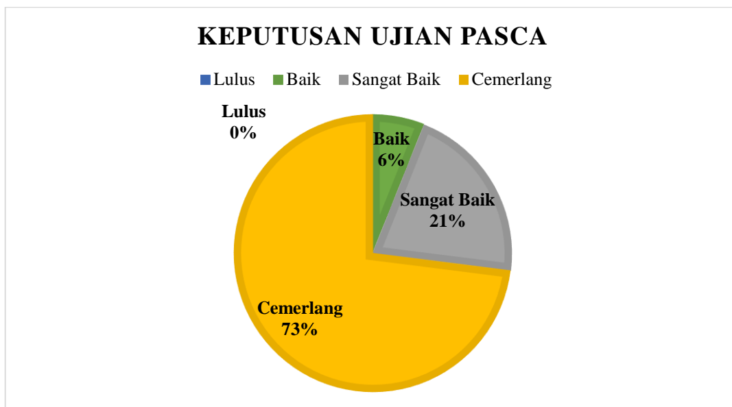
الشكل ٤: الرسم البياني الذي يوضح نسبة نتائج اختبار ما بعد التدخل

أظهرت نتائج الاختبار البعدي مقارنةً بنتائج الاختبار التمهيدي تحسناً كبيراً في إتقان الطلاب لمفردات اللغة العربية بعد تطبيق التدخل باستخدام أداة Ezy-Flash Mufrodat. وكما توضح البيانات، فإن التحسن ليس فقط كمياً، ولكنه أيضاً نوعي، مما يعكس تأثيراً إيجابياً واضحاً على أداء الطلاب في تذكر المفردات واستخدامها.