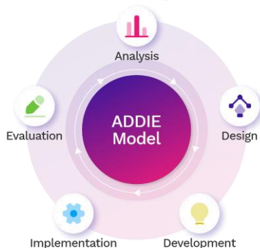
الشكل ١: المراحل الخمس لنموذج ADDIE حسب روسيت (1987)

تستند منهجية هذه الدراسة إلى نموذج ADDIE (التحليل، التصميم، التطوير، التنفيذ، والتقييم)، وهو نموذج تعليمي يهدف إلى تحسين جودة التعليم وتطوير بيئات تعليمية فعالة. وقد تم تطوير هذا النموذج من قبل روسيت (1987)، ويُستخدم على نطاق واسع في تصميم التدريس وتطوير المناهج التربوية. وفقاً لأيوب (2017)، فإن هذا النموذج يساعد في وضع خطط تعليمية منهجية وموجهة نحو تحقيق أهداف محددة بوضوح. ويتم تنفيذ الدراسة باستخدام الاختبارات القبلية والبعدي لقياس التحسن في مستوى إتقان مفردات اللغة العربية لدى الطلاب.