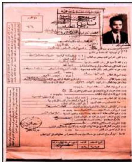
Rajah 4: Sijil syahadah al-Maahad al-'Ilmi lil Mu'allimin al-'Am