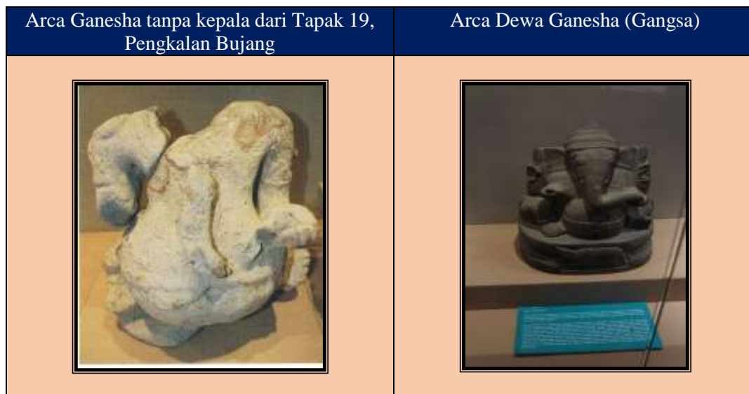
Foto 4 Arca Ganesha, Pengkalan Bujang