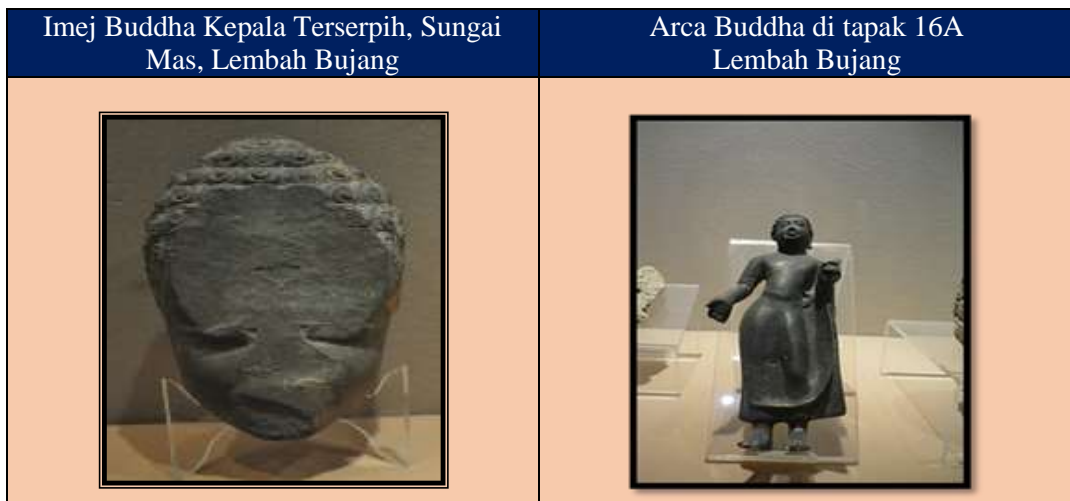
Foto 2 Arca Buddha, Lembah Bujang, Kedah

Selain dari Wales, Paul Wheatley juga tidak ketinggalan mengemukakan periodisasinya berhubung dengan perkembangan sejarah yang dilalui oleh Lembah Bujang (Paul Wheatley, 1959). Menurut Paul Wheatley sejarah Kedah bermula ketika Gunung Jerai, Bukit Penjara dan Bukit Batu Lintang masih lagi merupakan pulau di mana pedagang dari India mempunyai hubungan dengan masyarakat tempatan (Paul Wheatley, 1959). Kira-kira kurun ke-5 Masehi agama Buddha sudah bertapak di Lembah Bujang. Pada masa tersebut, hubungan dengan India sudah erat terjalin, tetapi tiga kurun kemudian agama Buddha telah diresapi oleh unsur Saivism di Kedah, dan penempatan tertumpu di kawasan tengah Sungai Bujang (Paul Wheatley, 1959). Bentuk candi yang menghala ke timur menunjukkan amalan linga dalam kalangan masyarakat Hindu di Kedah.