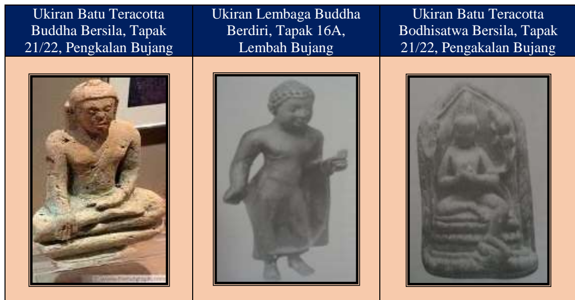
Foto 3 Ukiran Batu Terakota Buddha Bersila, Tapak 21/22, Pengkalan Bujang, Lembah Bujang (Terracotta)

Berdasarkan kepada jumpaan arkeologi, dapat dirumuskan bahawa semasa fasa awal perkembangan Kedah Tua sebagai sebuah pusat entreport, Sungai Mas dianggap sebagai pusat kerajaan terawal di Kedah Tua.