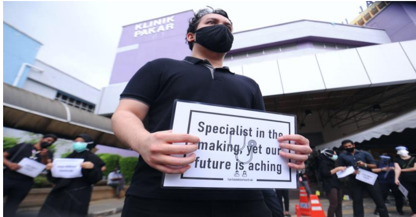
RAJAH 3 : Visual protes doktor kontrak