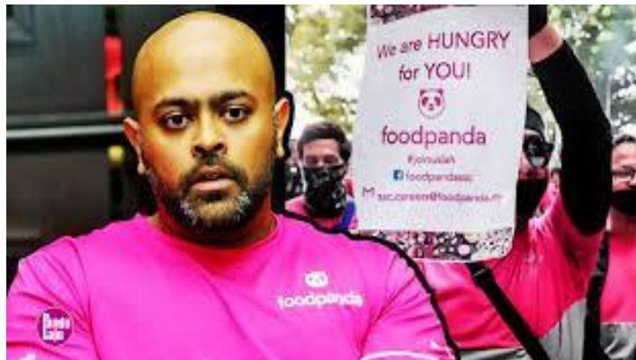
RAJAH 4 : Visual protes Foodpanda

disampaikan dan difahami oleh masyarakat.