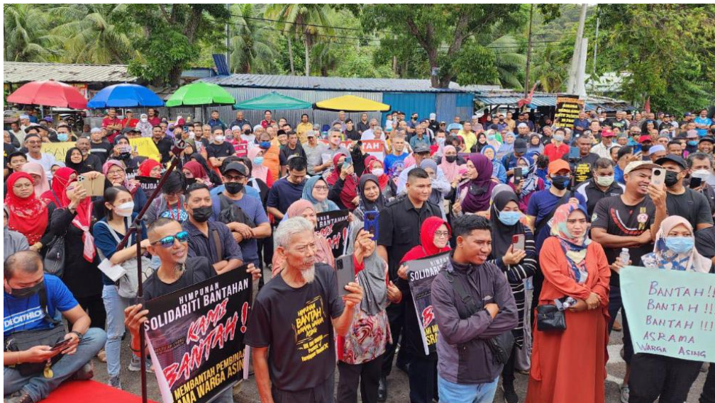
RAJAH 2: Visual protes pembinaan asrama warga asing

Bahagian ini akan membincangkan dan menghuraikan kuasa, ideologi dan perkaitan visual sosial disebalik visual protes berpandukan pendekatan dan penyesuaian Teori Analisis Wacana Kritis Fairclough (1992; 1995) dan Teori Semiotik Kress dan van Leeuwen (2006). Oleh itu, bahagian ini diketengahkan berdasarkan tiga visual protes yang akan dianalisis seperti dalam rajah 2, 3 dan 4 di bawah. Berikut merupakan analisis bagi Rajah 2: