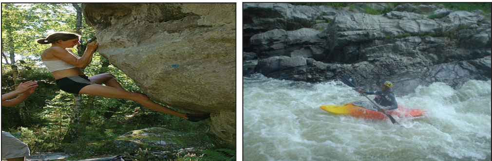
Gambar 1 Aktiviti-aktiviti yang dilaksanakan dalam pendidikan luar

Pendidikan Luar merupakan bidang pendidikan yang amat unik kerana menggabungkan proses pengajaran dan pembelajaran yang berasaskan teori dan praktikal di alam sekitar. Whittaker (1983) menyatakan pendidikan luar melibatkan aktiviti-aktiviti yang bersifat mencari ilmu secara tidak langsung seperti belayar, 'abseiling', berkayak, mendaki dan 'orienteering' di mana kesemuanya melibatkan alam semula jadi seperti air, angin, batu, hutan dan sebagainya. Manakala Priest (1986) mendefinisikan pendidikan luar sebagai suatu proses pengajaran dan pembelajaran yang berasaskan pengalaman nyata experiential learning dan secara amnya dijalankan di luar bilik darjah. Matlamat utama bidang ini ialah membentuk perubahan tingkahlaku yang berpanjangan melalui pengalaman sepanjang hayat.