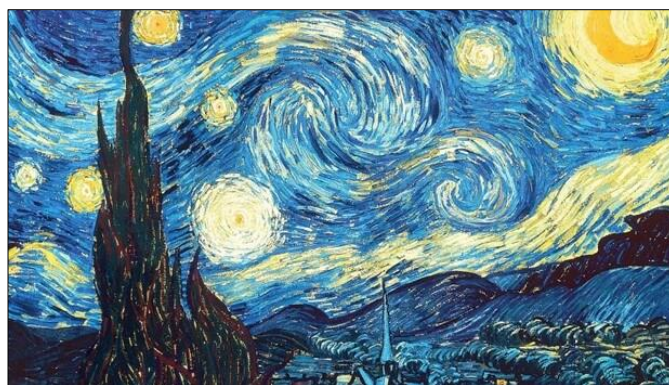
Rajah 1: Karya Starry Night oleh Vincent Van Gogh, 1889 Cat minyak atas kanvas 73.7 cm × 92.1 cm.