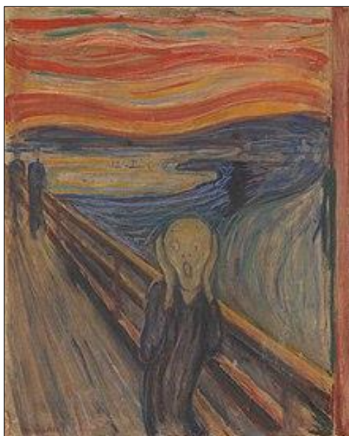
Rajah 2: Karya The Scream oleh Edvard Munch, 1893 Minyak, tempera, pastel dan krayon atas kadbod 91 cm × 73.5 cm (36 in × 28.9 in).

Rajah 2 menunjukkan mengenai sebuah karya oleh Edvard Munch bertajuk The Scream . Edvard Munch ialah seorang pelukis dan artis grafik dari negara Norway yang tersohor. Beliau telah membangunkan banyak karya seni yang membangkitkan respons dari segi pelbagai emosi daripada penonton. Namun begitu, kehidupan artis tersebut penuh dengan kerugian, ketakutan dan kerisauan. Dia bergelut dengan dirinya sendiri dengan gangguan mental sepanjang hayatnya. Karya The Scream ini terdapat pelbagai interpretasi. Seseorang pengkritik berpendapat bahawa ia seolah-olah mewakili kehilangan diri (lakaran gambaran orang), kehilangan hari (matahari terbenam) dan kehilangan orang terdekat lakaran gambaran dua orang). Melalui gambaran tersebut, ianya boleh dibandingkan dengan apa yang dialami oleh individu yang mengalami gangguan depersonalisasi. Ianya adalah perasaan terasing dari persekitaran dan diri sendiri (Skryabin, Skryabina, Torrado & Gritchina, 2020).