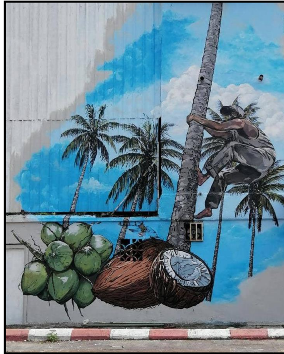
Rajah 3. Mural memanjat pokok kelapa.