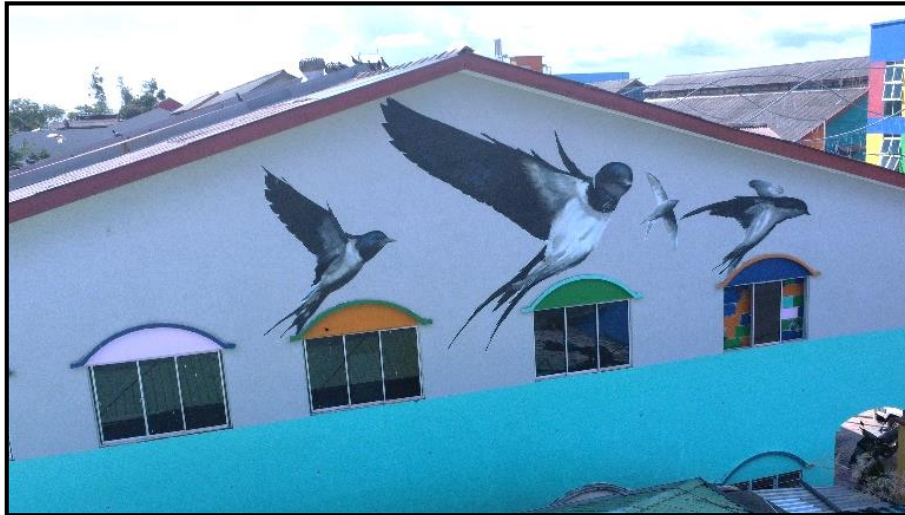
Rajah 5. Mural burung walit.