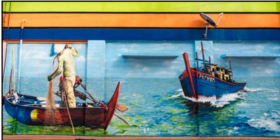
Rajah 4. Mural memukat di lautan.