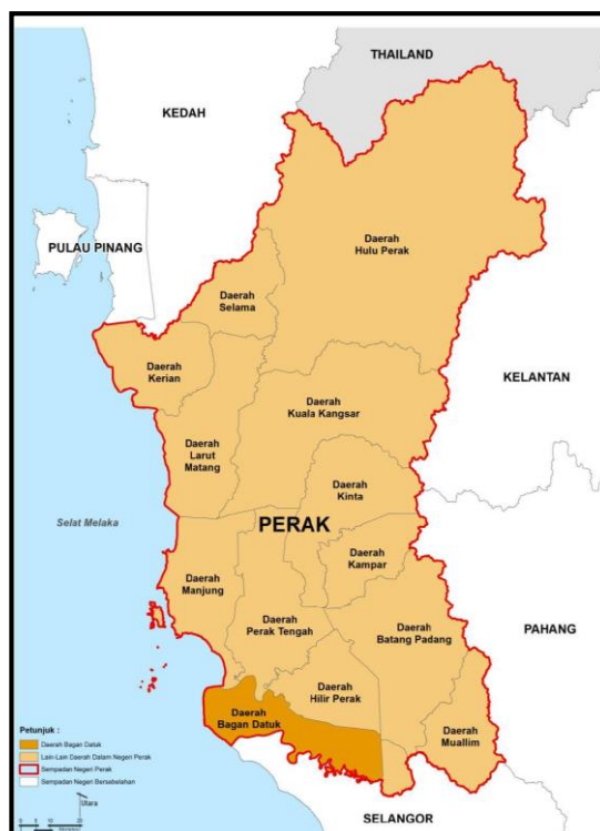
Rajah 1. Kedudukan Daerah Bagan Datuk Dalam Peta Negeri Perak. Sumber: Rancangan Tempatan Daerah Bagan Datuk 2035

Bagan Datuk merupakan daerah ke-12 dan bandar terakhir yang terletak di selatan Negeri Perak Darul Ridzuan. Sebelum ini Bagan Datuk dikenali dengan panggilan 'Bagan Datoh'. Lokasi tersebut pada asalnya dikenali dengan nama Sungai Keling dan ada juga memanggilnya dengan nama Pekan Baru. Namun ia telah ditukarkan kepada panggilan Bagan Datoh merujuk kepada lokasi penempatan rumah orang Melayu yang dibina di tebing sungai Perak yang menyambungkan jambatan ke daratan dikenali sebagai 'Bagan', manakala perkataan 'Datoh' yang bersempena dengan nama Tok Kelah telah digunakan lebih dari 100 tahun sebenarnya berpangkal daripada kesalahan sebutan orang Inggeris untuk menyebut 'Tuk' kepada 'Toh' (Datuk, 2023). Pada 9 Januari 2017, penukaran bagi menggantikan ejaan 'Datoh' kepada 'Datuk' telah diisytiharkan oleh Sultan Perak iaitu DYMM Sultan Nazrin Muizzuddin Shah Ibni Almarhum Sultan Azlan Muhibbuddin Shah Al-Maghfur-Lah yang kini dikenali dengan ejaan sebenar iaitu Bagan Datuk (Jasbinder, 2019).