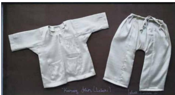
Rajah 4. Kurung Johor (Lelaki), Cloth, 116 x 65

Karya Chew Teng Beng yang bertajuk ' Love U - We Forgive U ' merupakan sebuah karya yang menggunakan teknik acuan sebagai blok dalam penghasilan karya. Bagi bahantara sebagai cetakan dalam penghasilan karya ini beliau menggunakan papercast sebagai medium pemindahan imej dari blok bagi mendapatkan edisi. Karya ini merupakan sebuah karya yang berbentuk 3 dimensi dan tidak mempunyai edisi. Karya ini diklasifikasikan sebagai sebuah karya cetakan alternatif dari segi penghasilan blok mahupun bahan pemindahan imej. Dalam penghasilan karya ini beliau telah menggunakan teknik acuan dalam menghasilkan cetakan beliau. Pada peringkat permulaan penghasilan karya ini beliau haruslah didahului oleh penyediaan acuan terlebih dahulu. Selepas itu beliau akan menghasilkan bahan bagi memindahkan imej dari blok dengan menghancurkan kertas untuk dituangkan ke dalam permukaan acuan tersebut. Jika diikutkan dengan penghasilan acuan ini, beliau boleh menghasilkan edisi yang banyak dalam karya ini seperti seni cetak konvensional.