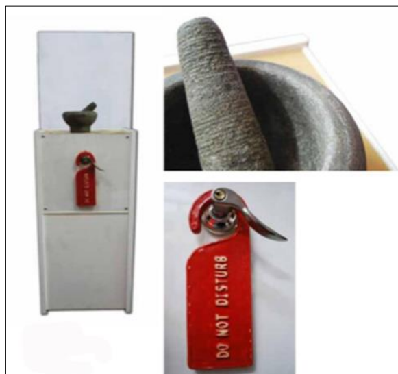
Rajah 2. Do Not Disturb, Mixmedia, Variable Dimension

Karya ini merupakan sebuah karya media campuran yang dihasilkan oleh Samsudin Wahab dan Zulhusni Ridzuan yang menggunakan teknik instalasi. Mengikuti temubual yang dilakukan dengan beliau di Chetak 12, karya yang dihasilkan oleh mereka dalam pameran ini merupakan satu eksplorasi beliau terhadap pemahaman beliau mengenai sifat ulangan yang terdapat dalam seni cetak. Bagi beliau padi yang ditanam dalam tulisan itu akan berada dalam keadaan sama jika padi tersebut dipotong beberapa kali. Hal ini disebabkan oleh acuan atau blok yang di bina (perkataan MUDA) itu akan menjadikan setiap potongan yang dilakukan akan mengakibatkan kesamaan. Konsep ini yang acuan dan hasil sama ini yang digunakan oleh pengkarya dalam memdefiniskan cetakan alternatif mereka. Penggunaan pokok padi ini menunjukkan bahawa penggunaan bahan atau kaedah yang digunakan dalam masyarakat seharian digunapakai dalam mendefinisikan karya cetakan berbanding penggunaan hasil cetak diatas permukaan kertas atau 2 dimensi.