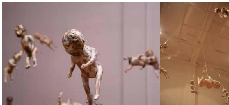
Rajah 6. Pakai Buang, Ceramics, Variable Dimension

Karya bertajuk I Need a Space merupakan sebuah karya alternatif dalam seni cetak di mana pengkarya menggunakan teknik ketepatan ukuran sebagai blok dalam penghasilan edisi yang banyak. Karya ini sama seperti apa yang dihasilkan oleh Ishak Ramli dalam menghasilkan karya beliau. Karya seperti ini tidak akan melihat kepada kesamaan edisi yang dihasilkan akan tetapi melihat kepada ukuran yang dipunpakai. Karya Noriza Arzain merupakan sebuah karya membentuk origami yang dihasilkan melalui lipatan. Menurut beliau karya ini dihasilkan dengan menggunakan teknik ketepatan ukuran sebagai blok dan hasil origami yang sama sebagai edisi yang terhasil daripada ukuran lipatan tersebut. Eklaborasi ini menampilkan satu kefahaman pengkarya yang memahami tentang konsep edisi yang dapat dihasilkan secara sama. Secara umumnya, kita mengetahui bahawa origami merupakan satu permainan hasil daripada lipatan yang sering dilakukan oleh kanak-kanak bagi merangsang otak mereka.