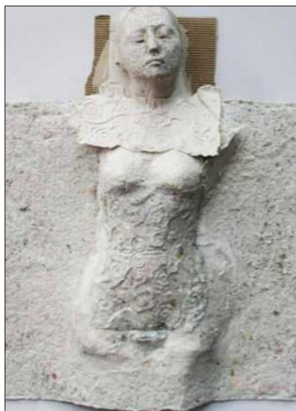
Rajah 3. Love Cast U: We Forgive U, Paper, 81 x 109 cm

readymade seperti apa yang dilakukan oleh Marcel Duchamp 2007. Antara teknik cetakan readymade yang boleh dilihat dalam karya ini adalah teknik acuan yang boleh lihat pada plat yang berwarna merah dan juga teknik ukuran yang terdapat pada lesung batu. Selain itu, teknik ukuran juga diperlihatkan kepada struktur untuk meletak lesung batu tersebut. Karya Do Not Disturb ini menyerupai konsep karya yang dihasilkan oleh Ponirin Amin 1980 iaitu Alibi Catur Pulau Bidong . Karya ini menceritakan tentang kehidupan manusia yang hidup secara kejurangan terutama sekali yang hidup di rumah flat yang selalu mengganggu masyarakat lain dengan aktiviti harian mereka.