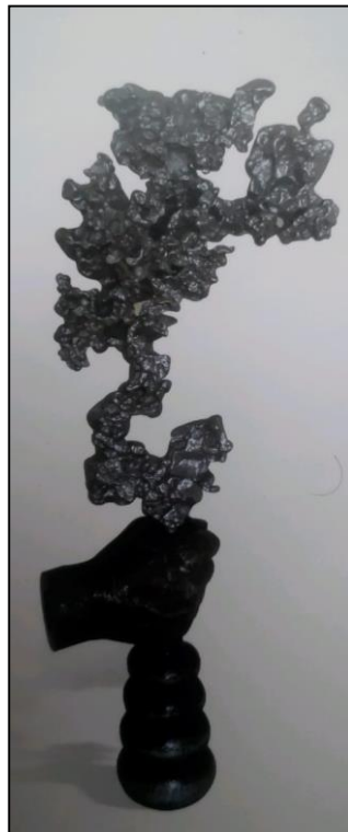
Rajah 4. “Perasap”, 2010, Tuangan Logam, 15 x 59 x 10 cm.

Karya yang bertajuk “Perasap” dihasilkan pada tahun 2010, juga menggunakan teknik tuangan logam. Karya ini bersaiz 15 x 59 x 10cm mengikut kepada saiz ukuran sebenar. Karya ini memperlihatkan tangan manusia dan bekas untuk membakar kemenyan sebagai objek utama. Aznan Omar memperlihatkan aktiviti pemujaan dalam persembahan karya. Penampakan gumpalan asap, kelihatan pada karya adalah penggunaan objek sekunder. Perasap adalah ganti nama pada aktiviti pemujaan. Kombinasi komposisi jelas dapat kelihatan dalam menyampaikan makna. Gambaran aktiviti pemujaan di persembahkan dalam karya “Perasap”, adalah simbolik kepada sindiran terhadap masyarakat yang masih mempercayai dan mempraktikkan aktiviti tersebut. Tujuan perasap atau pemujaan ini adalah supaya segala urusan dipermudahkan. Aznan Omar menyampaikan satira yang bersahaja dengan mengaitkan aktiviti yang sinonim dengan masyarakat yang mempercayainya.