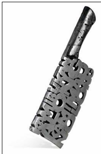
Rajah 3. “Kami Bukan Along Kami Mau Nolong”, 2010, Tuangan Aluminium , 28 x 9 x 21cm.