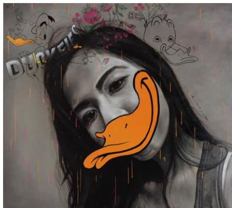
Rajah 2. Ruzzeki Harris. “#Duckfies”, (2015). Cat minyak atas kanvas, saiz 161.5 cm x 181.5 cm.

Seterusnya karya kedua Ruzzeki Harris dalam kajian ini juga merupakan salah satu karya dari pameran ini adalah bertajuk ‘Device’ seperti rajah 3 di bawah. Naratif visual rupa bentuk imejan karya ini secara kreatifnya menterjemah simbol robot yang mewakili android dan sebiji epal yang telah dimakan. Komposisi imejan juga disepadankan beberapa variasi rupa bentuk, garisan dari haiwan yang digambarkan dalam komposisi karya. Beliau menterjemah isu dan tema tentang sifat kepalsuan dan persaingan budaya menerusi trend penggunaan gajet dan peranti khasnya dalam penghantaran status di kalangan pengguna media sosial. Kupasan sumber idea ini adalah Perlambangan visual bagi mewakili secara khusus akan penggunaan sistem operasi familiar yang diguna oleh masyarakat seperti platform Android dan Apple. Signifikan karya adalah dilihat pada penampilan idea karya dalam pameran ini yang menyentuh isu budaya viral yang relevan dengan konteks semasa. Eksposisi catan ini sebagai cerminan makna artistik dari pelukis untuk penghayat seni bagi menyelami mesej secara tersurat dan tersirat yang ingin disampaikan oleh pelukis.