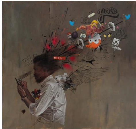
Rajah 4. Ruzzeki Harris. “Leka”, (2015).

konteks karya ini adalah tentang bagaimana Ruzzeki menyarankan pada masyarakat agar berwaspada dengan setiap perkara melibatkan gajet dan kandungan media sosial yang membina atau sebenarnya boleh membunuh karektor seseorang individu itu sendiri. Menurut Vogeler (2015), pameran ‘gone viral’ oleh Ruzzeki telah merepresentasikan imejan dari imaginasi tanpa sempadan beliau yang menonjolkan kelainan formalistik karya yang tersendiri. Beliau menterjemah imejan yang lahir dari budaya viral semasa yang wujud dalam masyarakat dengan cara menghasilkan tanda visual familiar serta sinonim dengan fenomena kehidupan masakini.