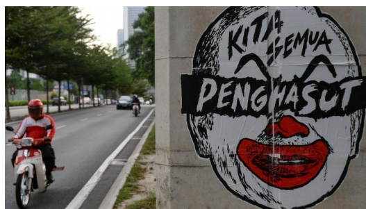
Gambar 3: Fahmi Reza, Reproduksi kartun (2018), Cat atas dinding konkrit.

Fahmi Reza mencetuskan kontroversi pada tahun 2009 apabila menghasilkan karya menggunakan cetakan gergasi wajah Najib Tun Razak yang diambil daripada 'bill-board' pada pameran "Rock Kaka: Fahmi Reza, Callen Tham, Fairuz Sulaiman, Saiful Razman and Vincent Leong" yang dianjurkan Valentine Willie Fine Art (VWFA) . Karya ini menjadi sensasi di media sosial apabila video bertajuk " Najib's head stolen from billboard " yang menampilkan proses pengambilan cetakan wajah Najib Tun Razak daripada bill-board dimuat naik pada platform media sosial 'Youtube'. Penghasilan karya dengan slogan "Kita Semua Penghasut" yang menampilkan wajah Najib Tun Razak dengan contengan berupa badut oleh Fahmi Reza pada tahun 2015 sekali lagi mencetuskan kontroversi di media sosial apabila menjadi tular di beberapa buah platform media sosial antaranya Twitter, Facebook, Instagram dan lain-lain.