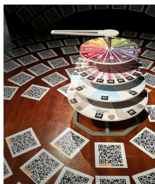
Gambar 5: T.C. Liew, Wheel of Fortune: Abyss of Malaysia Landscape, 2013. Pemasangan kod QR sebagai antara muka untuk mendapatkan pangkalan data dalam talian.