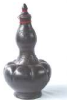
Gambar 4: Labu Gelugur