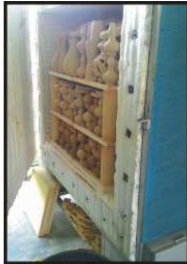
Gambar 8: Tanur Pembakaran Menggunakan Gas