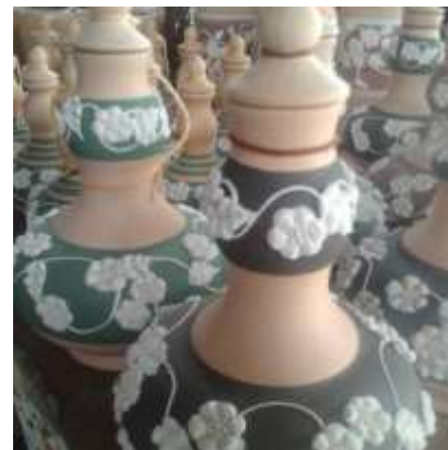
Labu Sayong Kontemporari