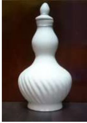
Gambar 7: Labu Panai Kontemporari

Asimilasi reka bentuk labu panai berlaku apabila pengusaha tempatan mengaplikasi kreativiti tersendiri. Hasil dari kajian ini, perubahan yang dapat dikenal pasti melalui material atau bahan yang digunakan untuk menghasilkan labu panai kontemporari. Bahan yang digunakan adalah sejenis tanah porselin menggantikan tanah Sayong. Penggunaan sekam digantikan dengan penggunaan pelbagai warna gelasir ( glaze ). Tidak menggunakan sebarang motif dan masih mengekalkan identiti labu panai. Proses asimilasi labu panai telah melahirkan labu panai kontemporari yang terdiri daripada lampu tidur, cenderamata dan hiasan.