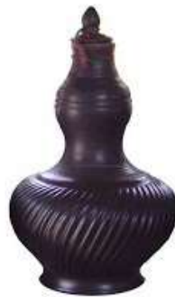
Gambar 6 Labu Panai

Labu panai ialah bentuk labu yang berhiaskan garis-garis lurus atau menyerong pada bahagian badannya. Garis-garis yang dipanggil panai ini dihasilkan dengan menempelkan tanah pada badan labu atau mengukir badan labu dengan alat pengukir yang dibuat sendiri. Terdapat juga panai yang dihasilkan dengan teknik gurisan. Teknik ini tidak meninggalkan kesan timbul pada badan labu. Motif siku keluang dan pucuk rebung pada bahagian atas badan labu manakala motif bunga cengkih, bunga pecah empat atau bunga tanjung diterap secara selari pada kepala dan penutup labu.