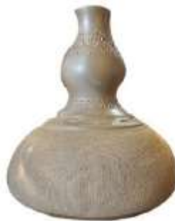
Gambar 2: Labu Tanah

Labu tanah adalah hasil daripada asimilasi yang berlaku pada labu air yang digunakan oleh masyarakat mukim Sayong. Reka bentuk labu tanah adalah ringkas, diilhamkan adalah seiras dengan buah labu air atau labu manis yang asli. Istilah labu tanah muncul berdasarkan material asas yang digunakan dalam pembinaan badan iaitu tanah. Penggunaan nama ‘tanah’ bertujuan untuk membezakan labu asli dengan tembikar. Gambar 2 menunjukkan reka bentuk tembikar tanah atau lebih dikenali sebagai labu licin.