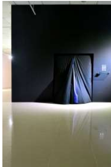
Rajah 3 Pandangan dari luar karya “Pembukaan”.

terjemahan Surah Al-Fatihah yang belatarbelakangkan hitam dan huruf tersebut berwarna putih. Pancaran projeksi tersebut bersaiz 3 meter lebar dan 2.5 meter tinggi. Manakala audio/muzik yang digunakan adalah ‘ Air on the G String ’ oleh Johann Sebastian Bach.