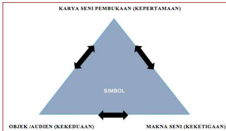
Rajah 2 Hubungan Model Triadik pada karya seni, objek yang berinteraksi dan makna menggunakan teori semiotik.