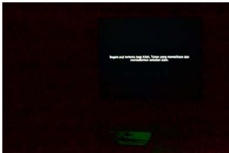
Rajah 4 Karya “Pembukaan”.