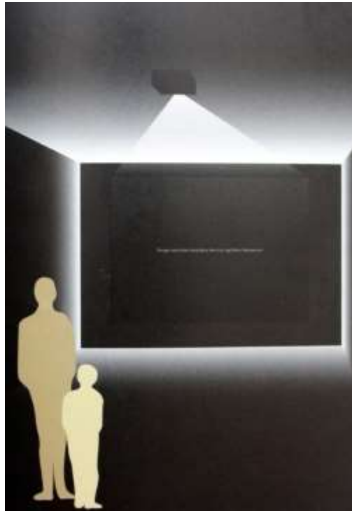
Rajah 5 Gambaran instalasi karya “Pembukaan”. Sumber Katalog Bakat Muda Sezaman 2013.