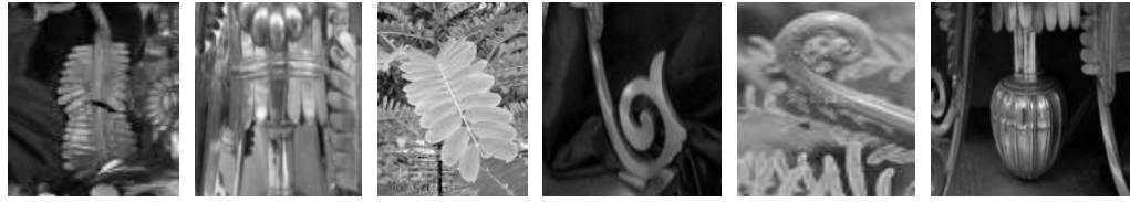
Gambar 16 Gambar 17 Gambar 18 Gambar 19 Gambar 20 Gambar 21

Gambar 16 Hiasan yang terdapat pada bahagian kaki.