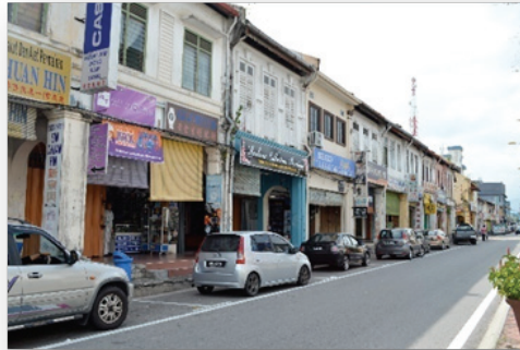
Gambar 4 Seni bina Dutch-Patrician and Neo-Classic di Tanjong Malim