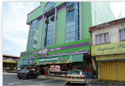
Gambar 5 Reka bentuk barisan kedai dan barisan bangunan lama

Persamaan yang jelas adalah reka bentuk jenis Dutch-Patrician dan Neo-Klasik . Ini jelas menunjukkan kesan sejarah masih kekal dalam semua unsur-unsur reka bentuk bangunan. Ciri-ciri reka bentuk yang unik ini memberikan imej tersendiri kepada kawasan tertentu. Syed ZainolAbidinIdid (1995), menjelaskan bahawa sesebuah bandar adalah bandar yang sempurna untuk mengimbangi tahap pembangunan dengan pemeliharaan kepentingan budaya dan mempunyai ciri-ciri tertentu yang membentuk suatu tempat, maka ia dinilai sebagai indah, menarik dan beridentiti. Keputusan jelas menunjukkan bahawa ciri-ciri tempat yang menarik dan beridentiti masih wujud tetapi ianya perlahan-lahan menghilang dan perlu dikekalkan demi masa depan bandar Tanjong Malim.