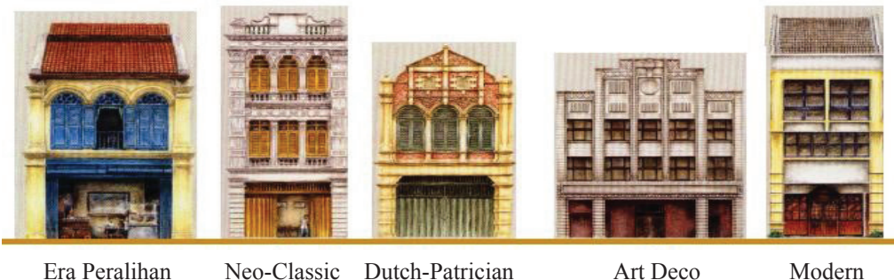
Gambar 3 Pengaruh seni bina di fasad rumah kedai

Hasil kajian menunjukkan bahawa bilangan elemen yang ada dan dikekalkan dalam setiap pembangunan baru di sekitar Tanjong Malim. Keputusan menunjukkan bahawa wujud aspek persamaan fasad rumah kedai di Chong Ah Peng, jalan utama di Tanjong Malim.