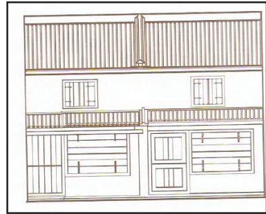
Gambar 1 Contoh rumah kedai awal