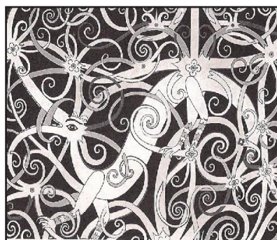
Gambar 10 Motif Kalong Balan Tana' Lenganan

Pernyataan tersebut menerangkan mengenai gambaran ciri-ciri fizikal naga dari sudut bayangan imaginasi masyarakat Orang Ulu. Sehubungan dengan itu, atas rasa kagum dan taksib terhadap binatang ini, maka bentuk binatang tersebut telah divisualisasikan oleh nenek moyang yang berjiwa seni ke dalam bentuk lukisan yang membawa kepada maksud kebangsawanan seseorang (Ding Lahang, 1996).