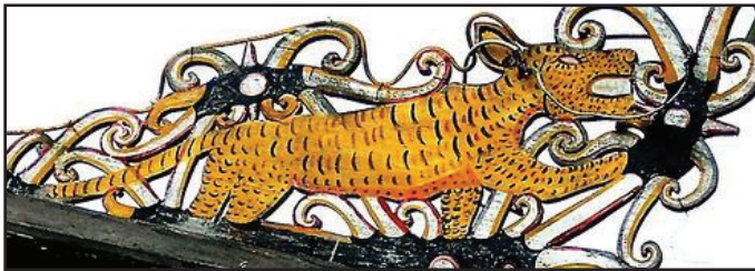
Gambar 5 Motif Kalong Lenjau

“...these motifs are restricted by social rank. The tiger, for example, would only be used by a deta’u (highest social ranking) person.”