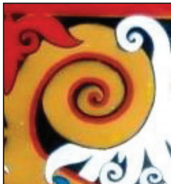
Gambar 12 Motif Kalong Beliling Bulan

Motif ini merupakan jenis Kalong yang tidak mempunyai nilai kelas atasan. Ia merupakan jenis Kalong biasa yang boleh digunakan oleh semua orang. Sifat atau bentuk asas Kalong Beliling Bulan ialah berbentuk lilit-bulat ( spiral ) seperti bentuk bulan (Gambar 12). Selain itu, bentuknya mudah dilukis kerana ia tidak begitu kompleks sepertimana jenis-jenis Kalong yang lain.