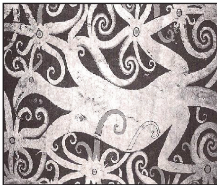
Gambar 7 Motif Kalong Kabok

Nama motif ini diambil sempena nama haiwan biawak ( Varanus rudicollis ). Walau bagaimanapun, motif ini bukan motif biawak (Gambar 7). Menurut sumber lisan dari Long Banyok Baram, Sarawak, motif ini diberi gelaran Kabok kerana bentuk lekukannya yang seperti bentuk “S” seolah-olah menggambarkan posisi badan seekor biawak atau cicak yang sedang berjalan (Jeffrey Jalong, 2001, hlm. 19).