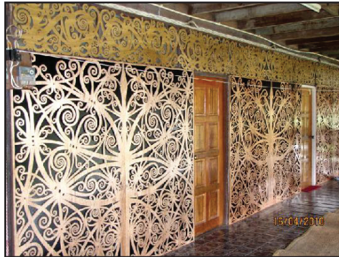
Gambar 3 Kalong Nding (ukiran dinding)