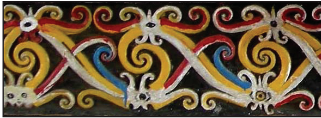
Gambar 9 Motif Kalong Aso'