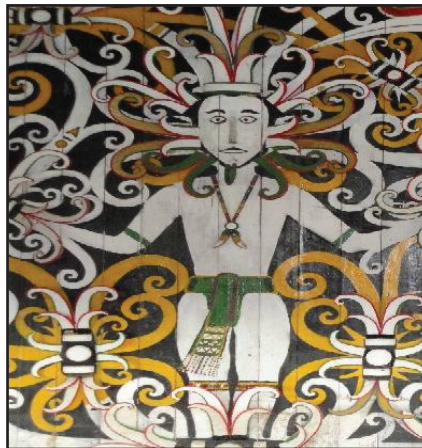
Gambar 4 Motif Kalong Kelunan

Kalong Kelunan menurut King (1985), merupakan lambang kepada roh hamba iaitu tawanan perang yang telah dikorbankan dalam upacara tertentu. Menurut kisahnya, motif Kalong Kelunan bermula semasa zaman mengayau. Semasa ekspedisi mengayau, pihak yang menyerang akan sedaya upaya untuk mendapatkan kepala pihak lawan dan dalam masa yang sama cuba untuk mendapatkan tawanan perang yang akan dijadikan sebagai hamba oleh golongan maren (atasan). Ini kerana dengan memiliki tawanan perang yang dijadikan sebagai hamba merupakan sesuatu yang dianggap berprestij tinggi bagi masyarakat Orang Ulu pada zaman dahulu. Oleh yang demikian, sebagai lambang berprestij ini maka motif manusia akan dilukiskan pada dinding rumah golongan maren atau ketua yang menyimpan tawanan perang tersebut.