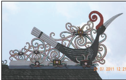
Gambar 6 Motif Kalong Tebengan