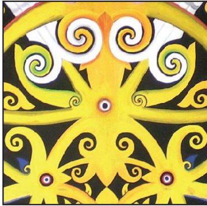
Gambar 8 Motif Kalong Udang