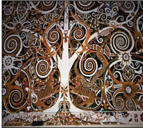
Gambar 2 Motif Kalong Kayu Aren

sosial masyarakat Orang Ulu. Oleh yang demikian, motif ini adalah sebagai tanda bahawa ketua rumah panjang tersebut ialah seorang ketua yang bijaksana serta berkemampuan untuk membimbing anak buahnya.