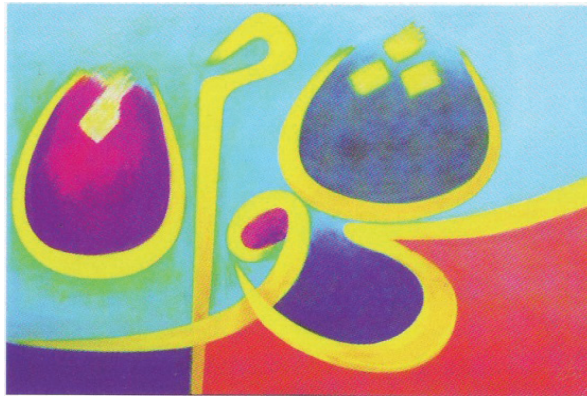
Rajah 8.4 Senyuman , 2009.

memperlihatkan gambaran senyuman pada wajah seseorang tapi ia merungkaikan satu persoalan yang menggunakan garisan dan warna yang mujarad. Garisan yang membentuk huruf jawi melahirkan tulisan yang beliau gelar tulisan Melayu yang mendukung makna “senyuman”.