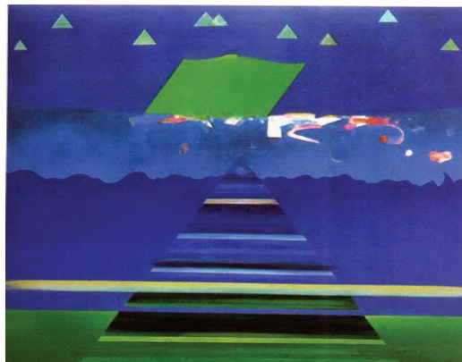
Rajah 8.1 Gunung Ledang Tanjung Kupang, 1978.

Catan Gunung Ledang Tanjung Kupang adalah satu karya yang mempunyai hubungan dengan mitos dan lagenda kesusasteraan Melayu. Catan ini adalah proses bentuk-bentuk tumpal yang menjadi kekuatan atau identiti beliau dalam catan-catan seterusnya yang dihasilkan. Menurut Syed Ahmad Jamal catan ini mempunyai satu kisah yang melibatkan diri beliau dan menjadikan ia sebagai lambang dan kisah yang digabungkan antara tragedi terhempasnya kapal terbang MAS di Tanjung Kupang dan sastera Melayu iaitu “Gunung Ledang”. Peristiwa malang ini terjadi di Tanjung Kupang pada tahun 1978, telah meragut kesemua nyawa penumpang kapal terbang MAS termasuk sahabat karib Syed Ahmad Jamal iaitu Datuk Ali Haji Ahmad, Menteri Pertanian Malaysia ketika itu.