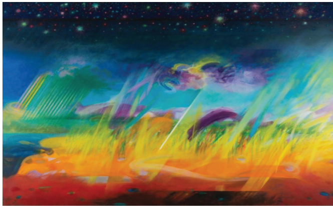
Rajah 8.5 Langit Dan Bumi , 1986.

Art is the essence of life. The observation of nature is absorbed into the inner self and later expressed to be seen by society as the image of the human soul. 3