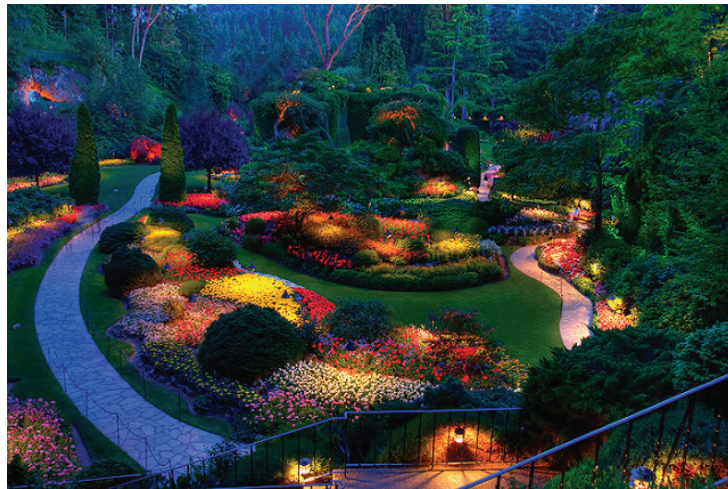
Rajah 6.6 Kesan cahaya lampu pada taman dapat memberikan watak yang berbeza.

Tanaman jenis berstruktur vertikal dan kanopi digabungkan bagi menyerlahkan fungsinya sebagai pokok teduhan dicadangkan bagi memberikan kesan teduhan. Beberapa jenis pokok yang dikategorikan sebagai tanaman ' vertical ' dan berdaun runcing iaitu pokok palma dan buluh. Gabungan pokok ini