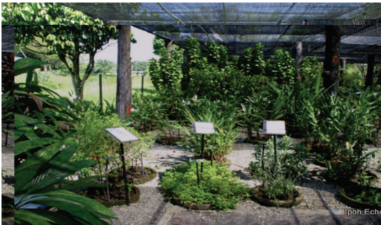
Rajah 6.3 Tanaman hiasan yang boleh dimakan.

Lazimnya, tanaman yang sering digunakan ialah tanaman yang mempunyai pucuk boleh makan seperti gajus dan menghasilkan buah seperti pisang dan kedondong. Begitu juga dengan suasananya yang bercirikan terapi boleh dimanfaatkan apabila taman membabitkan aktiviti memetik buah dan makan sambil bersantai. Pokok-pokok herba yang popular dan agak besar adalah seperti limau kasturi, pokok kari dan serai. Ada juga tanaman baru yang mula popular seperti epal Vietnam dan ceri Siam. Kedua-dua tanaman ini mempunyai buah dan pasti akan menjadi kegemaran anak-anak. Ini secara tidak langsung dapat memberikan manfaat besar kepada pengguna untuk menggunakan pokok tersebut bagi kegunaan harian. Selain daripada itu, taman ini juga boleh dijadikan lokasi berkelah dengan keluarga memandangkan terdapat beberapa tumbuhan yang boleh dipetik dan dimakan.