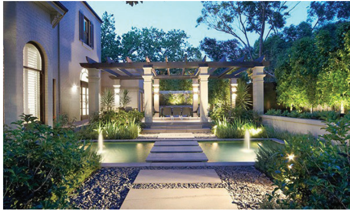
Rajah 6.4 Kolam air berpancuran begitu sinonim di kawasan taman.

Hembusan angin yang kuat akan memberikan satu bunyi yang unik jika dedaun dari pelbagai spesies pokok tersebut berlanggaran sesama pokok dan akhirnya dapat menimbulkan satu suasana yang berbeza. Justeru, adalah penting jika kepelbagaian jenis spesies pokok disatukan di dalam reka bentuk tanaman bagi mewujudkan keanekaan rupa, tekstur dan warna sekali gus dapat menyatukan sekumpulan pokok ini bagi menghasilkan bunyi apabila angin bertiup. Ini jelasnya dapat memperlihatkan bahawa kesatuan kesemua elemen deria ini bakal membina satu taman yang lengkap bagi memenuhi keperluan penyembuhan seseorang individu.