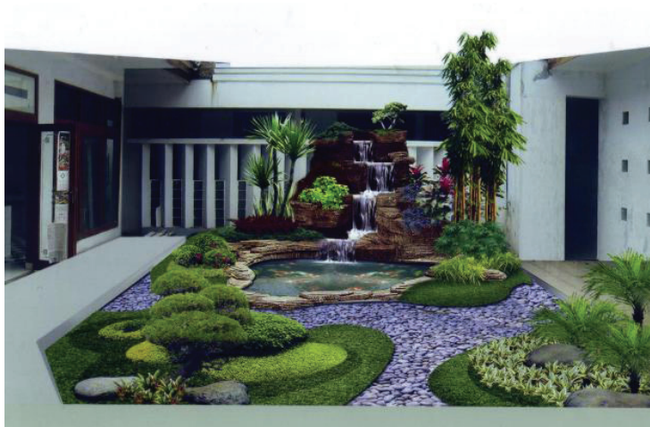
Rajah 6.5 Pemilihan pelbagai saiz pokok dan jenis menjadi satu tarikan daripada segi warna dan tekstur kepada sesuatu taman.

plant yang dapat memberikan satu gambaran keindahan di sudut pandangan mata. Watak sesuatu taman itu mula berubah di waktu malam apabila cahaya daripada lampu taman dipancarkan. Lampu taman yang terdiri daripada pelbagai saiz iaitu antaranya lampu yang tingginya 1 meter sehinggalah lampu pancaran terus " spotlight " yang diletakkan di sebalik rimbunan pokok, mampu memberikan wajah baru sesuatu kawasan taman pada waktu malam.