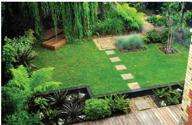
Rajah 6.1 Elemen pokok yang pelbagai spesies dapat memberikan deria sentuhan yang berbeza bagi pengguna taman.

Selain daripada itu, deria sentuhan dapat memberikan pengetahuan daripada aspek pembelajaran dan mengenali benda baru khususnya kanak-kanak. Walau bagaimanapun, aspek keselamatan perlu dititikberatkan bagi mengelakkan berlaku kecederaan semasa mereka berjalan tanpa kasut di atas rumput atau pasir yang dapat memberikan sentuhan semula jadi kerana sebagai pereka bentuk landskap, ini adalah satu aspek penting jika ingin memberikan satu deria sentuhan yang berbeza dengan elemen tumbuhan. Justeru, penyenggaraan tanaman adalah penting dalam memastikan rumput berkenaan selamat untuk dipijak tanpa kasut bagi mengelakkan terpijak benda tajam.