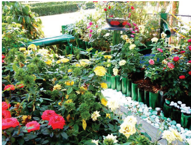
Rajah 6.2 Pelbagai spesies tumbuhan berbunga yang dapat memberikan kesan kepelbagaian bau.

Deria bau memainkan peranan yang tidak kurang pentingnya dalam membangunkan taman penyembuhan. Walaupun aspek ini tidak dapat dilihat, tetapi kesan bau yang dihasilkan mampu memberikan ketenangan dan rasa yang berbeza dalam membina taman penyembuhan. Ini secara tidak langsung dapat menimbulkan rasa ingin tahu untuk menerokai taman berkenaan.