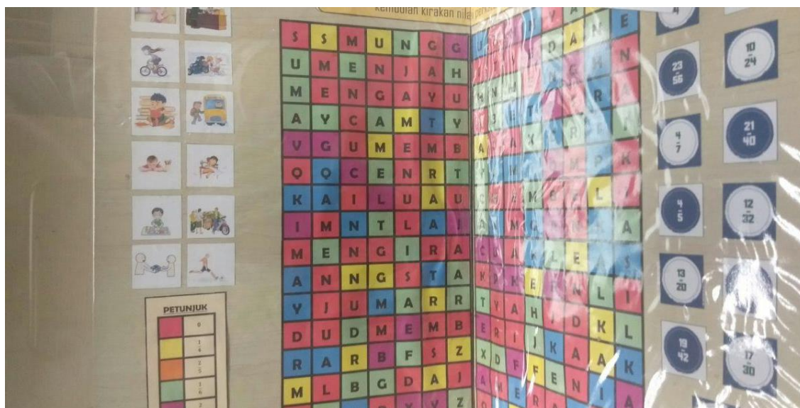
Rajah 2. Gambar Fraction Cipher

FC perlu dipraktikkan menggunakan satu kaedah pembelajaran yang menyeronokkan agar dapat meningkatkan lagi keberkesanannya melalui penerapan konsep gamifikasi. Gamifikasi yang dimaksudkan ini menggabungkan cara pengajaran dan pembelajaran operasi pecahan dalam Matematik dan pengukuhan kosa kata Bahasa Melayu melalui permainan teka silang kata versi kod kriptografi. Menurut Huang dan Soman (2013), gamifikasi merupakan kraf yang menghasilkan unsur-unsur yang menyeronokkan dan ketagihan yang terdapat dalam permainan dan menggunakannya untuk aktiviti kehidupan seharian. Hal ini akan membantu guru menarik minat dan perhatian pelajar ke arah sesi pengajaran dan pembelajaran yang disampaikan. Gamifikasi merujuk kepada aplikasi unsur reka bentuk permainan untuk aktiviti bukan permainan dan telah digunakan untuk pelbagai konteks termasuk pendidikan (Nah, Zeng, Telaprolu, Ayyappa, and Eschenbrenner, 2014). FC