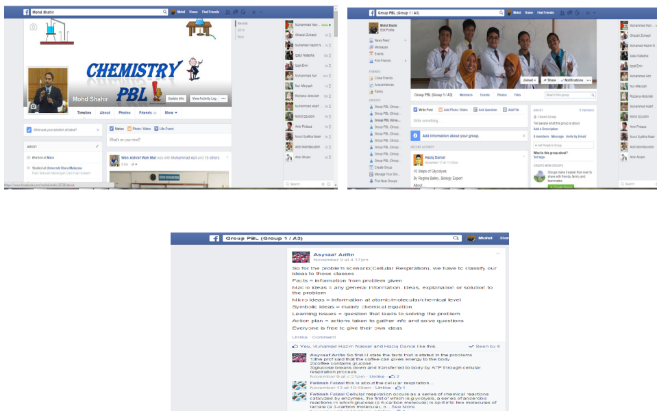
Gambar rajah 1 Contoh Paparan Muka Hadapan Salah Satu Kumpulan PBL Berserta Perbincangan.