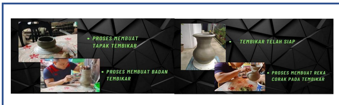
Gambar 3: Penghasilan karya kreatif Seramik

Pelajar berjaya melaksanakan proses pengaplikasian grafik dan mereka corak dalam penghasilan story board . Dimana penghasilan ini menerapkan gabungan artist rujukan, karya rujukan, lakaran, pilihan lakaran dan perkembangan ideas dalam kajian dihasilkan secara terperinci. Pemahaman dan penerapan konsep rupa jiwa telah membuahkan hasil yang baik dapat dilihat melalui penghasilan yang dihasilkan. Penggunaan taipografi dan susunan juga berjaya mewujudkan teknik yang kreatif dan mudah difahami.