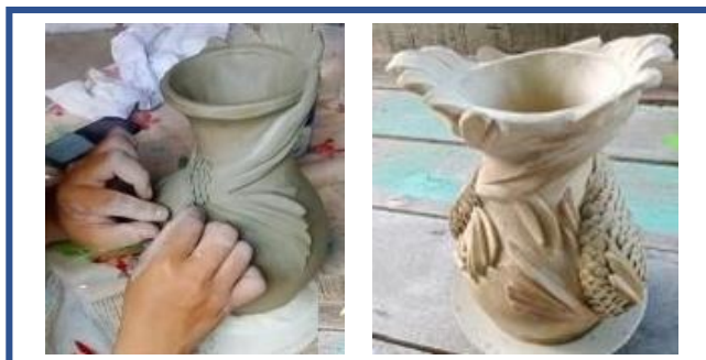
Gambar 4: Kekemasan dan penelitian terhadap proses penghasilan 2D kepada 3D

sendiri. Pelajar ini menggunakan kaedah cut iaitu kaedah cantuman pada badan karya yang dibahagi kepada 2 bahagian. Bertujuan untuk mempercepatkan proses penghasilan karya. Pelajar seni ini mengasingkan bahagian badan karya, setelah ia sesuai untuk dicantum, pelajar gam tanah liat (slip). Kekemasan dan ketelitian amat dititikberatkan dalam proses penghasilan karya.