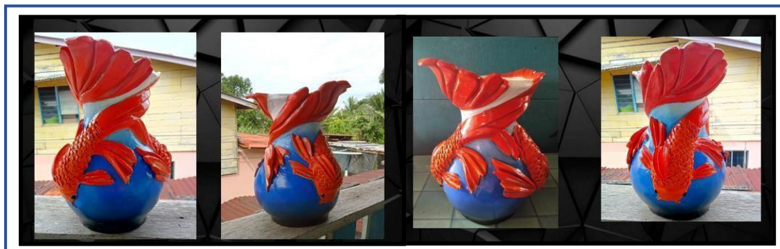
Gambar 5: Karya Kreatif Keramik Kontemporari

Berdasarkan gambar diatas, ianya dapat dilihat ketekunan peserta dalam menghasilkan karya yang asalnya daripada bentuk 2D kepada 3D. Pengamatan dan penelitian terhadap proses yang dilaksanakan membuktikan bahawa keberkesanan model praktis studio seramik dapat difahami dan diikuti oleh pelajar seni dengan mengutamakan keberhasilan dalam penghasilan beradaptasikan konsep rupa dan jiwa dalam penghasilan karya. Penyatuan yang dapat dilihat dalam gambar diatas menunjukkan tahap pengamatan dan penerapan penggunaan teknik dan subjek matter telah membuktikan bahawa pelajar seni ini berjaya mewujudkan nilai estetika melalui penghasilan ukiran dan reka corak pada badan tembikar kontemporari yang dihasilkan. Pengaplikasian reka corak ini membuktikan tahap kesabaran dan disiplin pelajar seni ini sangat berwibawa dan positif.