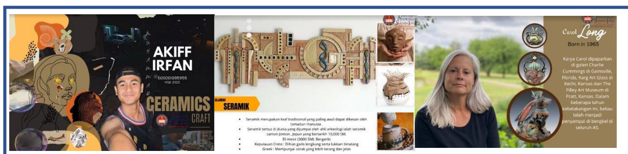
Gambar 2: Penghasilan Portfolio kreatif

Berdasarkan gambar diatas, pelajar seni berjaya membuktikan bahawa beliau memahami prosedur gerak kerja dalam model praktis studio seramik dengan betul. Berdasarkan pengamatan dan pengajian secara terperinci pelajar seni ini didapati membuat kajian penyelidikan bagi mengenalpasti lokasi dan ciri-ciri tanah liat alternatif bersandarkan model praktis studio seramik sebelum melaksanakan pencarian tanah liat alternatif. Penemuan lokasi tanah liat alternatif ini terbukti diperolehi di kawasan sekitar kediaman pelajar seni berdasarkan penelitian dan kajian terhadap kadar keplastikan dalam bentuk rekod dan pendokumentasian. Penemuan di peringkat eksplorasi ini telah memberi titik mula dalam penemuan kearah kefahaman tentang tanah liat secara konvensional berlandaskan keberkesanan model praktis studio seramik. Pengujian kadar keplastikan juga berjaya diaplikasikan melalui pengujian dalam bentuk “ring”.