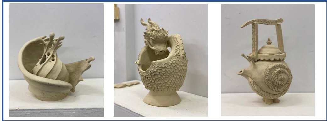
Gambar 6: Karya Kreatif Berdasarkan Penerapan Konsep Rupa & Jiwa

dengan baik sekiranya prosedur khusus yang boleh membimbing dan mendorong dalam sesuatu penghasilan karya.