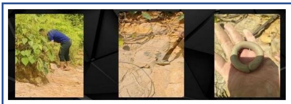
Gambar 2: Kejayaan pelajar seni menemui lokasi tanah liat alternatif di Sungai Rejang Kanowit Sarawak

artistik ini berjaya mendorong dan membentuk minat kalangan pelajar seni terhadap pengguna konsep rupa dan jiwa terhadap penghasilan seramik kontemporari berasaskan model praktis studio seramik. Kejayaan dalam kajian ini telah membuktikan bahawa nilai estetika, penerapan, keindahan dan penyatuan dalam rupa dan jiwa telah terlahir kembali melalui dorongan dan panduan khusus bersandarkan model yang disediakan. Tujuannya adalah untuk memastikan pelajar menghasilkan karya dan proses gerak kerja memenuhi cita rasa dan menanam nilai kasih sayang dalam penghasilan karya. Tanpa jiwa dan rupa sesuatu karya yang dihasilkan tiada jiwa dan ianya tidak akan menarik serta memberi kesan kepada audien. Peranan kefahaman dan tahap pembelajaran secara ilmiah dan praktis juga penting bagi memastikan rasa dan kepuasan pada penghasilan karya itu wujud. Hal ini kerana ianya memberi kesan kepada yang mengamati dan menghayati setiap hasil produk yang dihasilkan.