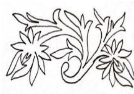
Gambar 8: Lakaran Motif Bunga Kekwa

Chrysanthemum nama saintifik bagi bunga kekwa. Bunga daripada keluarga Asteraceae ini banyak dilihat di Asia dan Eropah Timur. Di Malaysia, bunga kekwa juga banyak ditanam di Cameron Highland yang bersuhu sejuk. Mempunyai keunikan dari segi rupa dan bentuk serta jalinan kelopak berlapis telah dijadikan sumber inspirasi pengolahan idea motif dalam seni tekak. Apresiasi tukang seni tekak dalam mengolah semula rupa bentuk bunga kekwa membuktikan kearifan lokal pembuat seni tekak terhadap keindahan flora.