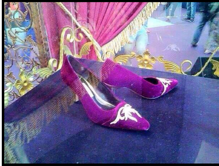
Gambar 6: Rekaan Kasut Kolaborasi Bersama Jimmy Choo

kasutnya. Kesan ragam hias seni tekat telah menghasilkan kasut yang direka kelihatan eksklusif dengan rekaan yang berasaskan kontemporari moden. Penggunaan dari pemilihan fabrik bagi rekaan kasut tersebut telah dihasilkan dengan inovasi kreatif Mardziah yang menggabungkan kemahiran kearifan dengan kehendak pasaran yang bersifat kontemporari. Selain itu juga, beliau turut menggabungkan rekaan seni tekat dengan nilai kepenggunaan dengan nilai estetika masih mengekalkan bahan asli benang emas, benang perak serta benang yang pelbagai kerana kolaborasi ragam hias rekaan tekat pada rekaan kasut rekaan Jimmy Choo ini telah membuktikan bagaimana kearifan lokal dapat diadaptasikan dalam penghasilan barangan utiliti moden.