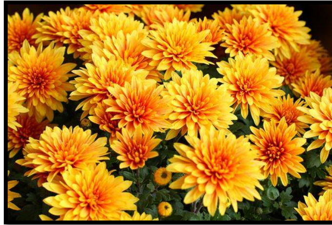
Gambar 7: Bunga Kekwa

Chrysanthemum nama saintifik bagi bunga kekwa. Bunga daripada keluarga Asteraceae ini banyak dilihat di Asia dan Eropah Timur. Di Malaysia, bunga kekwa juga banyak ditanam di Cameron Highland yang bersuhu sejuk. Mempunyai keunikan dari segi rupa dan bentuk serta jalinan kelopak berlapis telah dijadikan sumber inspirasi pengolahan idea motif dalam seni tekak. Apresiasi tukang seni tekak dalam mengolah semula rupa bentuk bunga kekwa membuktikan kearifan lokal pembuat seni tekak terhadap keindahan flora.