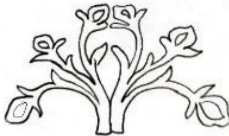
Gambar 10: Lakaran Motif Bunga Cengkih

Syzygium aromaticum atau Eugenia aromatica adalah nama saintifik bagi bunga cengkih. Dalam dunia masakan bunga cengkih merupakan daripada kumpulan keluarga herba atau rempah ratus yang mempunyai banyak khasiat dan selalunya, bunga cengkih ini digunakan dalam masakan kerana mempunyai aroma yang unik.