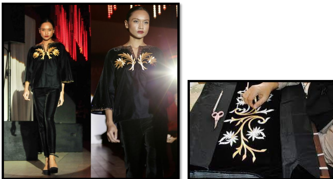
Gambar 5: Rekaan Busana Rizman Ruzaini Berasaskan Seni Tekat Benang Emas Bermotifkan Bunga Kekwa

Rizman Ruzaini mengadaptasikan seni tekat pada koleksi rekaan pakaiannya dan telah memilih Mardziah sebagai individu yang melaksanakan proses awal penghasilan reka corak seni tekat pada fabrik. Dengan berbekalkan pengalaman kreatif dan praktis, beliau Berjaya mengeksplorasi seni tekat dengan pelbagai jenis fabrik.