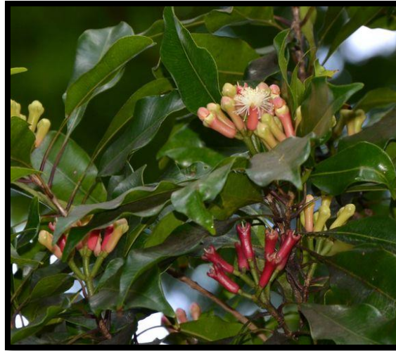
Gambar 9: Pokok Bunga Cengkih

Syzygium aromaticum atau Eugenia aromatica adalah nama saintifik bagi bunga cengkih. Dalam dunia masakan bunga cengkih merupakan daripada kumpulan keluarga herba atau rempah ratus yang mempunyai banyak khasiat dan selalunya, bunga cengkih ini digunakan dalam masakan kerana mempunyai aroma yang unik.