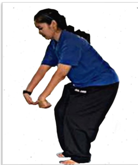
Gambar 3: Ragam Tari Menimba Air/Membuang Air