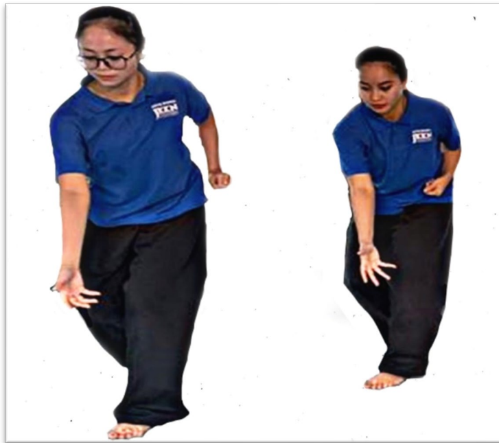
Gambar 6: Ragam Tari Menarik Rawai

Menurut Amri Ahmad (temu bual, 2020), menarik rawai merupakan satu proses untuk menarik hasil tangkapan yang tersangkut pada rawai yang dibentangkan di laut. Jika panjang rawainya, maka makin tinggi kebarangkalian hasil yang diperoleh, dan jika pendek rawainya maka hasil yang diperoleh adalah sebaliknya. Dalam hubungan ini, bukan hasil yang dimaksudkan tetapi rawai itu yang menjadi perlambangan bahawa semakin jauh atau panjang perjalanan seseorang itu, maka semakin tinggi ilmu atau pengalaman yang diperoleh. Dessit Duano menyifatkan simbol panjang rawai melambangkan semangat untuk terus mengorak langkah bagi memburu kejayaan seperti yang ditunjukkan oleh anak-anak desist Duano di Kampung Kuala Benut, Benut Pontian. Hal ini kerana ramai yang telah berjaya dalam pendidikan dan memperoleh kerjaya yang baik, seperti kata bidalan, ‘ Semakin Jauh Perjalanan Semakin Banyak Pengalaman ’.