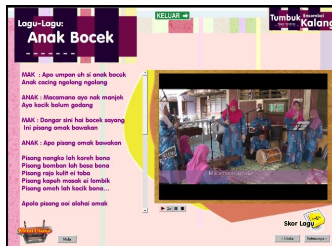
Rajah 6: Contoh papan muka Lagu dan Video Ensembel Muzik Tumbuk Kalang