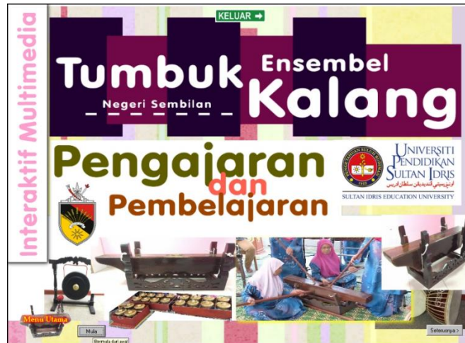
Rajah 2: Contoh muka depan