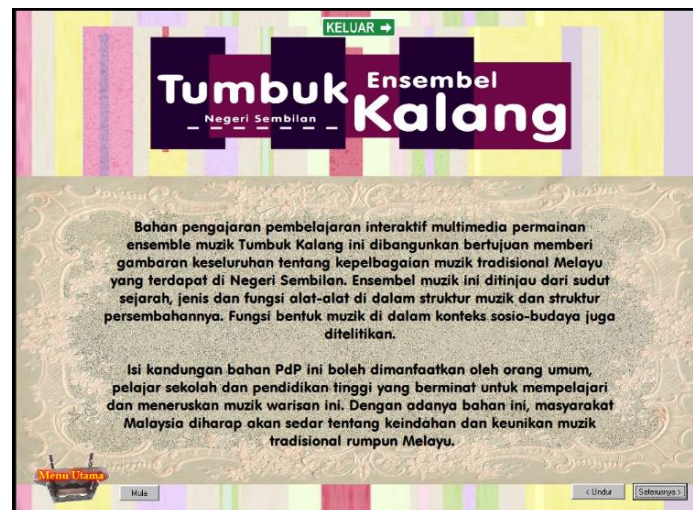
Rajah 3: Contoh papan muka Pengenalan