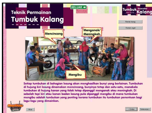
Rajah 7: Contoh papan muka Teknik Permainan

Berikut dipaparkan dapatan data soal selidik berkaitan kesesuaian bahan multimedia interaktif pengajaran dan pembelajaran ensembel muzik Tumbuk Kalang Negeri Sembilan yang dibangunkan sebagai bahan pembelajaran di sekolah daripada perspektif pakar teknologi pendidikan muzik. Berdasarkan item dan sub-item yang disoal, tahap 5 menunjukkan kesesuaian tinggi manakala tahap 1 menunjukkan tidak sesuai.