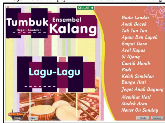
Rajah 5: Contoh papan muka Lagu-lagu Tumbuk Kalang