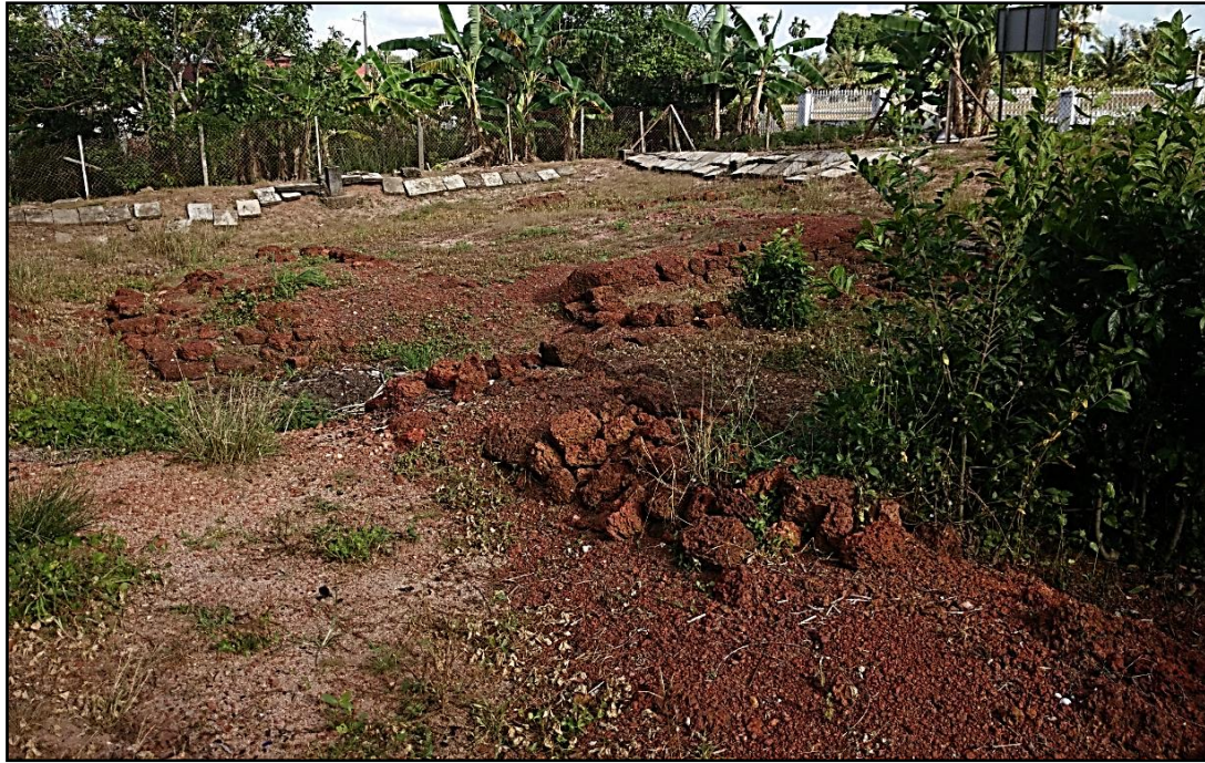
Rajah 4: Tapak 31 di Matang Pasir berhampira Kota Kuala Muda antara tapak yang lebih terjaga. Kebanyakan tapak lain telah pun musnah.

Beberapa tapak yang telah dikaji pada tahun 1956 telah dirancang untuk diekskavasi pada tahun berikutnya. Antaranya termasuk tapak di Matang Pasir yang telah dinamakan Tapak 31. Aktiviti gali cari yang lebih intensif telah dilaksanakan dan Sullivan (1958) berpendapat bahawa struktur ini mungkin digunakan untuk pemujaan agama Buddha dan mungkin berasal dari kurun kesembilan atau kesepuluh Masihi, bertentangan dengan pendapat Quaritch-Wales bahawa struktur ini dibina pada kurun ketiga belas Masihi. Lebih penting, Sullivan dapat menunjukkan bagaimana struktur ini telah dibina. Lapisan paling bawah dibina menggunakan pecahan laterit. Lapisan di atasnya telah dibina menggunakan campuran bata, laterit dan batuan manakala lapisan paling atas telah diisi menggunakan pasir.