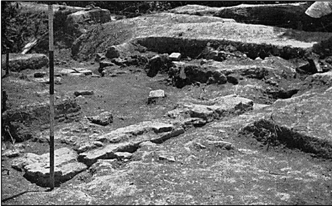
Rajah 3: Tapak 24 ketika ekskavasi pada tahun 1956. Kawasan tapak ini tidak boleh dijumpai sekarang.

Satu lagi tapak yang telah dijumpai oleh Quaritch-Wales dan telah digalicali oleh Sullivan adalah Tapak 24 yang terletak berhampiran pekan Tikam Batu dan berhampiran Sungai Muda. Sullivan telah menjumpai satu dinding bata sepanjang 60 kaki di atas asas laterit dan juga struktur kecil berbentuk segi empat. Di bawah dasar ini terletak lapisan batu yang telah dipecahkan dan juga tanah. Bata yang telah dipecahkan secara sengaja juga telah dijumpai. Selepas aktiviti gali cari yang lebih mendalam, Sullivan (1958) telah mengatakan bahawa tapak tersebut mungkin dibina di antara kurun kesepuluh dan keempat belas Masihi. Di tapak ini, satu pelantar yang telah dijumpai oleh Quaritch-Wales telah menarik perhatian Sullivan (1957). Artifak seperti lingam, bali-pitha dan pelapik tiang telah dijumpai dan ini menentukan bahawa struktur tersebut merupakan struktur untuk upacara pemujaan. Tapak tersebut telah diranapkan dan bahan digunakan dalam pembinaan jalan berhampiran.