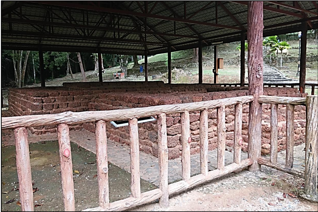
Rajah 2: Rekonstruksi Tapak 16 di perkarangan Muzium Arkeologi Merbok. Tapak asal terletak berhampiran Pengkalan Bujang.

Tapak 16 mula ditemui dan digali cari oleh Quaritch-Wales dalam ekskavasi ringkas beliau ke atas Tapak 1-30 yang dilaksanakan sejurus sebelum Pendudukan Jepun. Sama seperti kerja lain yang dilaksanakan beliau, tapak ini hanya dikaji secara ringkas oleh beliau. Dasar tapak tersebut tidak dikaji sehingga Stargardt telah mengkajinya pada awal tahun 1970-an (1973). Kerja beliau penting untuk memahami lapisan dasar yang berbeza. Stargardt melaporkan bahawa terdapat lima lapisan dasar yang berbeza untuk Tapak 16. Di dalamnya beliau mengatakan bahawa lapisan pertama terdiri daripada tanah liat yang telah dipadatkan, lapisan kedua terdiri daripada batuan sungai, lapisan ketiga terdiri daripada bata yang telah dipecahkan dan tanah. Lapisan keempat terdiri daripada bongkah yang telah dipecahkan dan bata yang telah dilumatkan menjadi tanah liat. Lapisan teratas adalah bongkah laterit dan bata jemuran matahari. Lapisan ini dijadikan pelantar untuk struktur tersebut.