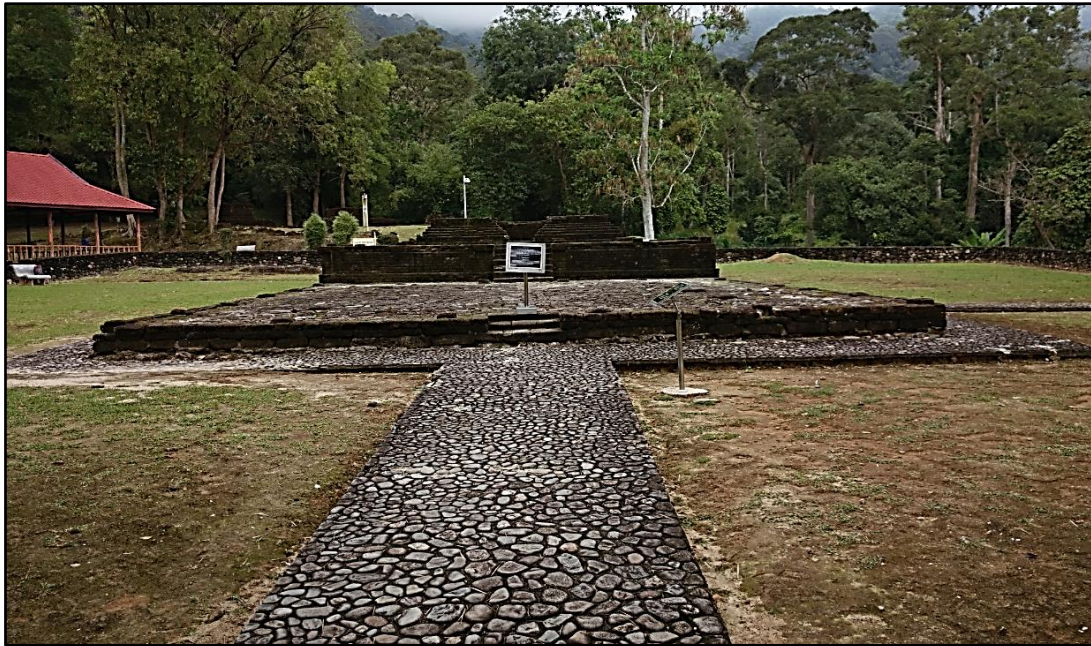
Rajah 1: Pembinaan semula Tapak 8 di Merbok, Kedah. Tapak asal terletak di tapak yang sama

Kesemua tapak di Lembah Bujang yang ditemui sebelum 2007 telah lengkap diekskavasi oleh arkeologis tetapi sebahagian besar tidak dikaji cara pembinaannya. Kurang terdapat tumpuan ke atas dasar struktur. Hanya lapisan dasar Tapak 8, 16, 24 dan 31 dikaji dengan terperinci. Struktur yang memuatkan bahan binaan yang tahan lasak perlu mempunyai dasar struktur yang dibina menggunakan bahan yang sama ataupun lebih lasak. Struktur seperti rumah kayu dan tembok tanah pula tidak memerlukan dasar yang istimewa.