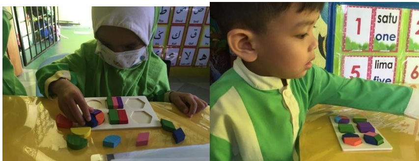
Rajah 6.4.3 Gambar kanak-kanak Berjaya menyusun Puzzle 3D Bentuk dalam papan 2D