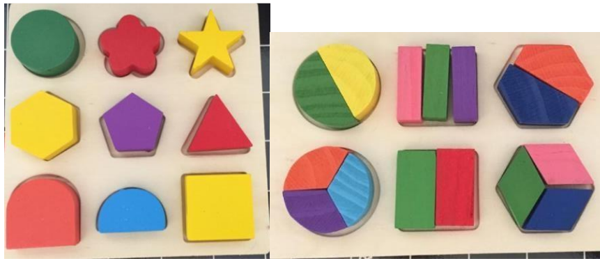
Rajah 6.4.2 Gambar Penggunaan Bahan Maujud Dalam Matematik Awal Bentuk 2D Dan 3D