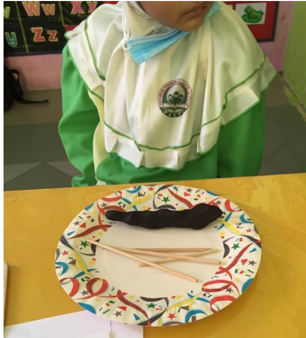
Rajah 6.4.1 Gambar Kanak-Kanak Tidak Dapat Membentuk 2 Dimensi Menggunakan Lidi Dan Tanah Liat.