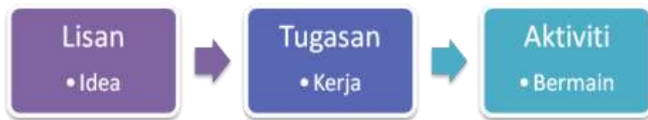
Rajah 2: Peringkat intervensi berdasarkan proses Think-Group-Share

(memikir), “Group” (berkumpulan) dan “Share” (berkongsi).