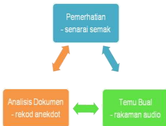
Rajah 1: Cara-cara pengumpulan data

Pengkaji telah mengambil keputusan untuk menjalankan kajian ini berasaskan Model Kagan. Think-Group Share yang merupakan pengubahsuaian Think-Pair-Share daripada Model Kagan. Terdapat 3 proses utama dalam kaedah Think-Group-Share . Proses pertama (Think), murid diberi masa yang cukup untuk memikirkan intervensi yang berkaitan dengan topik yang diberikan. Proses kedua (Group), murid mencari ahli kumpulan sendiri dan berkongsi idea dengannya. Manakala proses ketiga (Share), murid berkongsi secara lisan atau bukan lisan. Proses ketiga ini boleh dalam bentuk cadangan, idea dan hasil kerja.