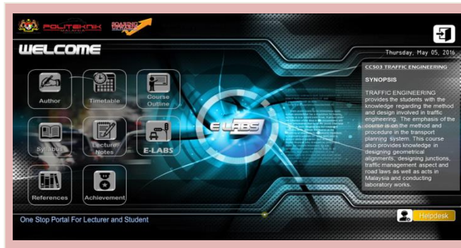
Rajah 2: Paparan skrin menu utama ‘e-LABS’

multimedia yang interaktif seperti grafik, animasi, teks, audio dan video yang dipaparkan melalui satu paparan menu utama ‘e-LABS’ seperti dalam Rajah 2. Manakala, Rajah 3 memaparkan butang navigasi notes, tests, lab works, mini project, presentation dan course info untuk membolehkan pelajar melakukan proses pembelajaran secara dalam talian dengan baik.