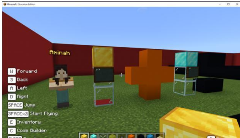
Rajah 2: Penambahan pecahan sama penyebut