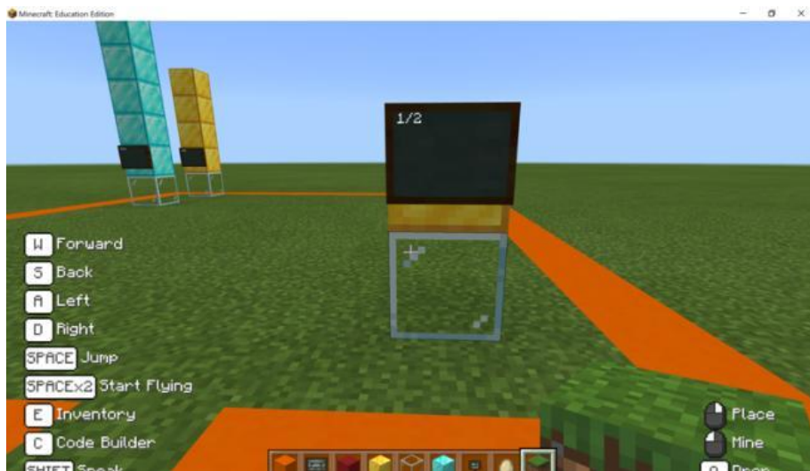
Rajah 1: Susunan blok yang membentuk nilai pecahan ‘satu per dua’

blok tersebut, yang juga dikenali sebagai manipulatif iaitu bahan atau objek yang dimanipulasi, aktiviti berkaitan operasi asas seperti menambah, menolak dan mendarab pecahan dapat dilakukan dalam persekitaran dunia Minecraft. Pelaksanaan aktiviti hands-on ini akan membantu mewujudkan hubungan antara aktiviti berkenaan dengan konsep pecahan yang abstrak kerana dengan berinteraksi serta melakukan aktiviti secara hands-on , kemahiran matematik murid akan dapat dipertingkatkan dan ini sekali gus membantu murid untuk memahami konsep matematik yang abstrak kerana murid dapat memvisualisasikan konsep tersebut dengan baik dalam minda (Holmes, 2013; Kontaş, 2016). Manipulasi yang dilakukan ke atas bahan manipulatif sama ada dalam bentuk objek konkrit mahupun bentuk maya berupaya membantu dalam memperkukuh pemahaman konsep matematik (Hartshorn & Boren, 1990). Bruner (1977), Dienes (1973) dan Piaget (1965) turut menyatakan bahawa murid akan membina pengetahuan yang semakin kompleks melalui penglibatan aktif dengan bahan manipulatif. Rajah 2 menunjukkan contoh aktiviti penyelesaian masalah pecahan yang dapat disediakan oleh guru untuk dilaksanakan oleh murid di dalam persekitaran dunia maya Minecraft. Bagi menyelesaikan permasalahan berkenaan, murid perlu melakukan manipulasi hands-on terhadap kedudukan atau susunan blok tersebut dan ini dapat dilakukan dengan memecah, menambah dan menyusun blok-blok tertentu.