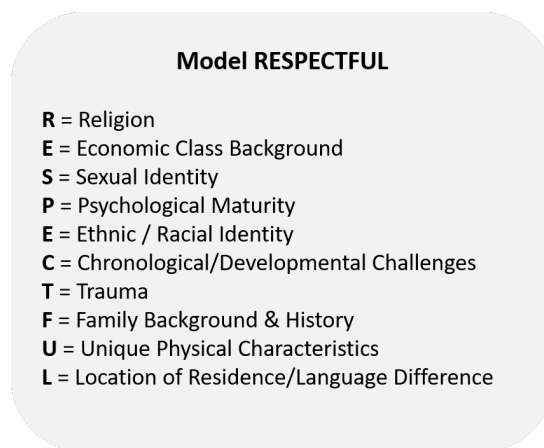
Rajah 1: Model RESPECTFUL (D'Andrea & Daniels, 1997; 2001)

sedar atau pun tidak sedar. Oleh itu, kemungkinan kewujudan sikap diskriminasi dalam diri kaunselor pelatih dapat dilihat dengan menggunakan model RESPECTFUL.