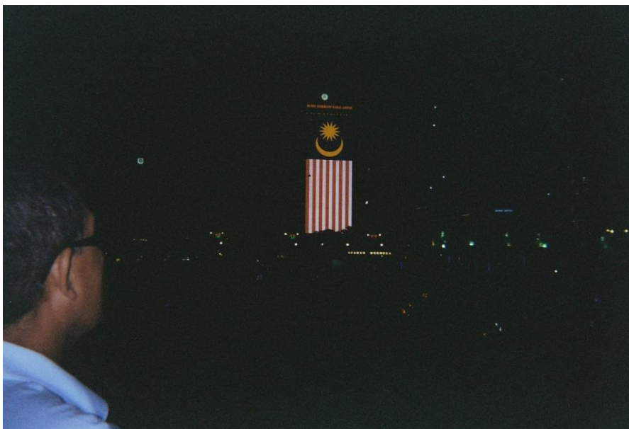
Foto 3: Keadaan kawasan hiburan yang gelap dan takut takut dengan manusia yang dilihat asing

Ulfa: Ya enggak ada la semuanya bagus-bagus aja... lagi juga kalau disini itu banyaknya orang yang sama kayak kita kn. Muslim juga ramai gitu. Tapi kalau tadi kita kan naik teksi itu kayaknya kurang bagus... apa namanya orang India itu lihatnya kotor, enggak bersih bajunya. Kakinya juga kotor... jadi kita takut ... lagi pula sering ditipu-tipu kan. Malahan dekat aja... tapi ongkosnya gini.