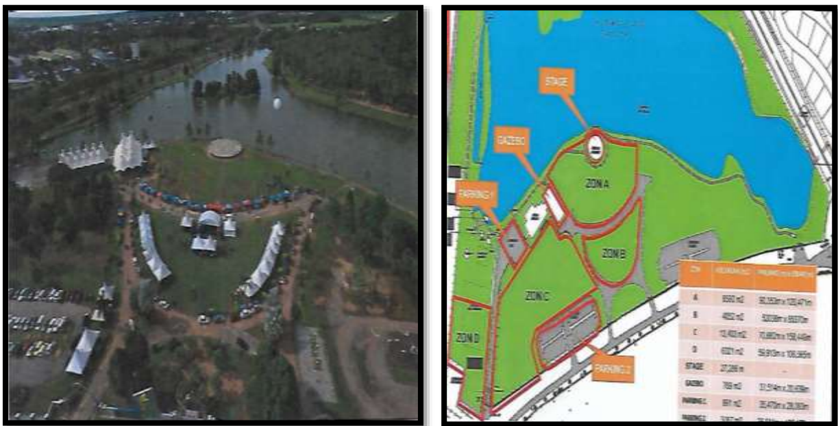
Rajah 3 Pemandangan kawasan Taman Rekreasi Tasik Darulaman