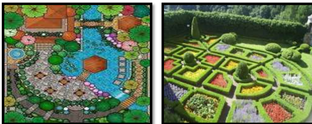
Rajah 1 Contoh-contoh reka bentuk landskap