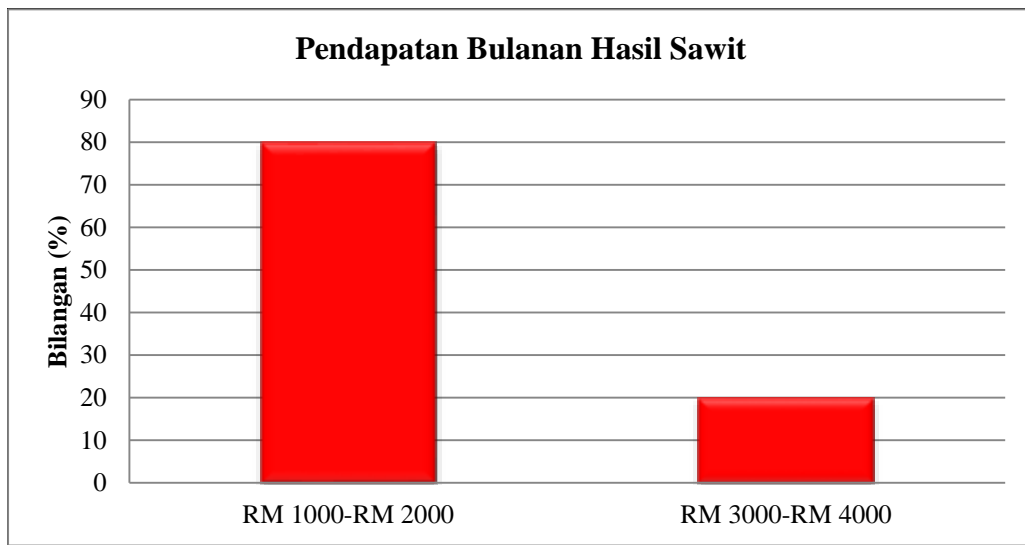
Rajah 2 Pendapatan bulanan hasil sawit