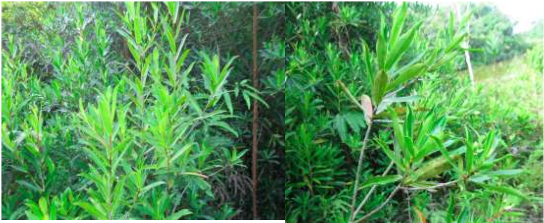
Foto 2 Spesies pokok Ploiarium alternifolium

Penentuan IVi dalam kajian ini telah melibatkan sebanyak 868 bilangan individu yang terdapat di dalam 15 subplot yang berkeluasan 4500 m 2 atau 0.45 hektar. Hasil kajian mendapati sebanyak 53 spesies yang telah berjaya direkodkan bagi keseluruhan plot kajian. Hasil kajian juga menunjukkan spesies pokok Ploiarium alternifolium (Foto 2) mencatatkan IVi yang tertinggi iaitu 24.23 peratus atau 10.32 peratus untuk jumlah keseluruhan individu yang dijumpai (Jadual 4). Manakala spesies kedua yang mencatatkan IVi tertinggi adalah Cratoxylum arborescens (Vahl) var. arborescens dengan nilai peratusan IVi sebanyak 10.9 peratus atau 4.64 peratus untuk 53 spesies yang direkodkan. Manakala spesies ketiga yang mencatatkan IVi tertinggi ialah Syzygium papilose (Duthie) Merr. & Perry dengan IVi sebanyak 8.36 peratus atau 3.56 peratus bagi keseluruhan 53 spesies yang direkodkan. Seterusnya, dapatan kajian juga menunjukkan terdapat spesies yang mencatatkan IVi terendah di dalam 868 individu yang dijumpai, iaitu spesies pokok Cinnamomum pubescens Koch. dengan nilai IVi sebanyak 1.24 peratus atau 0.53 peratus bagi keseluruhan 53 spesies yang direkodkan.