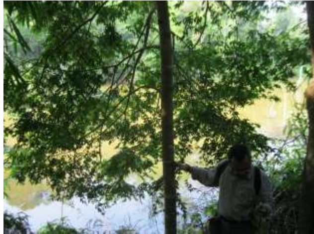
Foto 1 Famili Myrtaceae