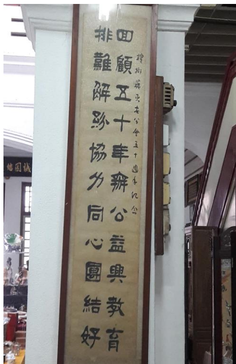
图片二十四：“回顾五十年办公公益兴教育，排难解纷协力同心团结好”

图二十四的“回顾五十年办公公益兴教育，排难解纷协力同心团结好”字体属于隶书体式，笔意相当圆融温润。