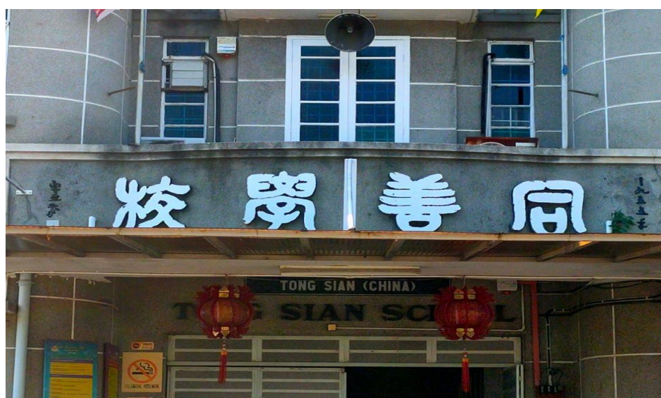
图片八：“同善学校”