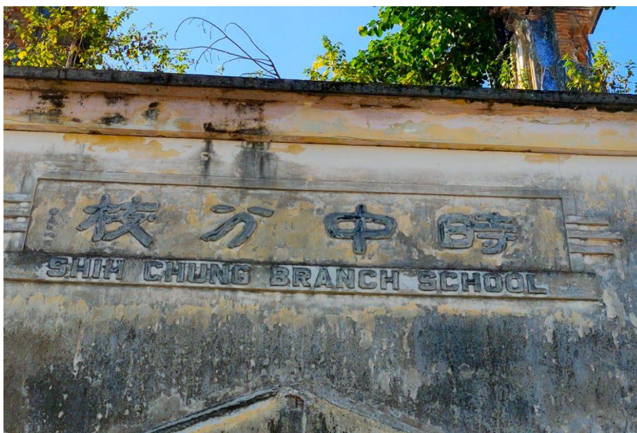
图片十六：“时中分校”

图片十六“时中分校”应亦取法《北齐泰山经石峪金刚经》，结体宽博疏朗，静穆平和，笔画呈动感。