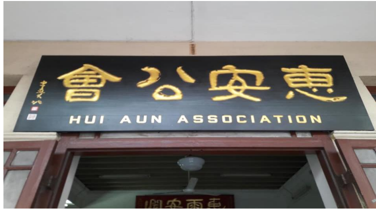
图片十七：“惠安公会”