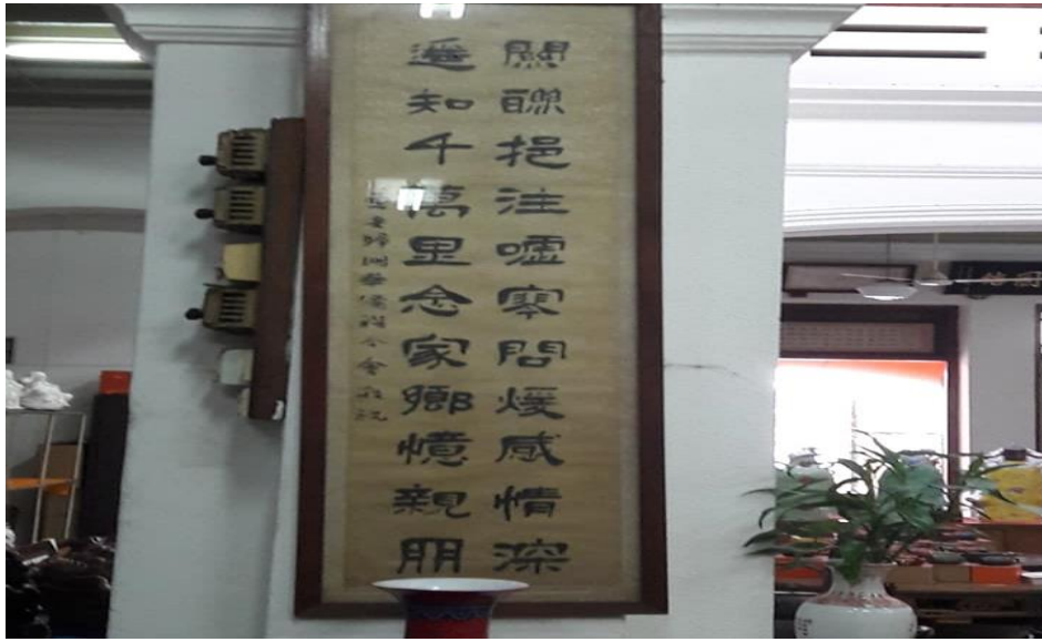
图片二十五：“关联挹注虚寒问暖感情深，遥知千万里念家乡忆亲朋”

图片二十五“关联挹注虚寒问暖感情深，遥知千万里念家乡忆亲朋”的字体为隶书体式，笔意圆融温润。