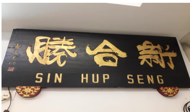
图片十九：“新合胜”