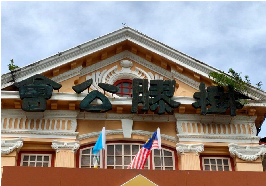
图片十三：“树胶公会”

图片十三“树胶公会”之笔意亦取法《北齐泰山经石峪金刚经》，用笔圆润厚重，雄浑朴茂。