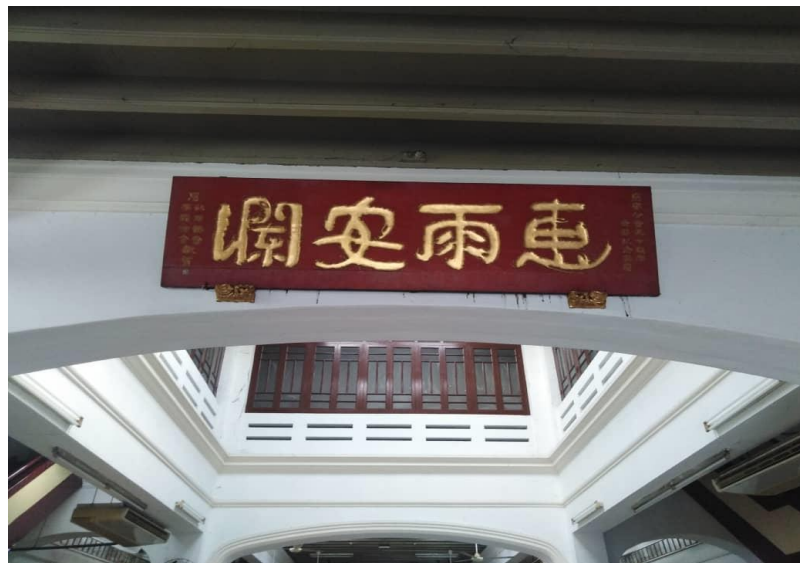
图片十八：“惠雨安澜” 64

图片十七与十八的外门上“惠安公会”，内部“惠雨安澜”两个匾额是以隶书体式书写并稍融入了篆意笔法。