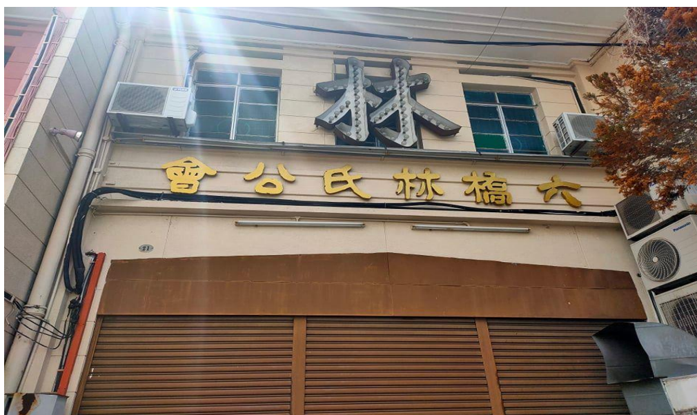
图片十二：“六桥林氏公会”

图九的“槟华商业联合会”、图十的“潮商公会”及图片十一的“乐园”可见出崔大地应师法东晋的《好大王碑》的隶篆之间的运笔，它们呈现出崔大地朴厚古茂、均匀遒健、雄壮浑厚的书写特点。