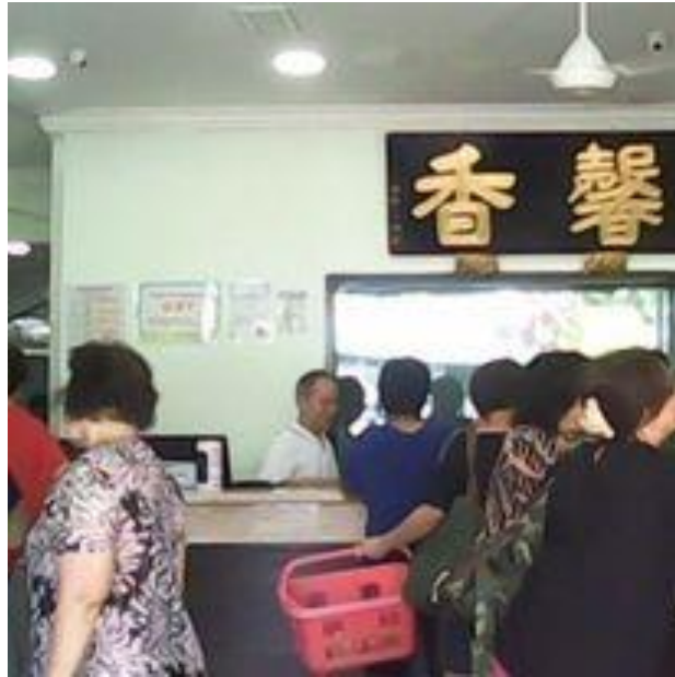
图片二十一：“馨香”