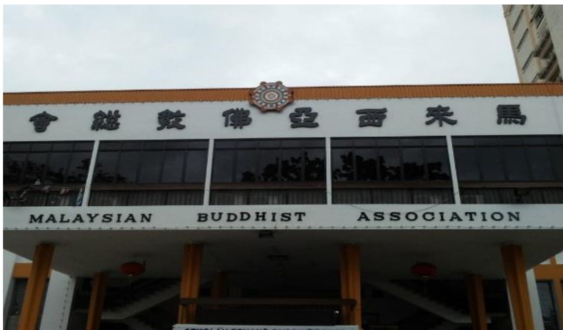
图片七：马来西亚佛教总会