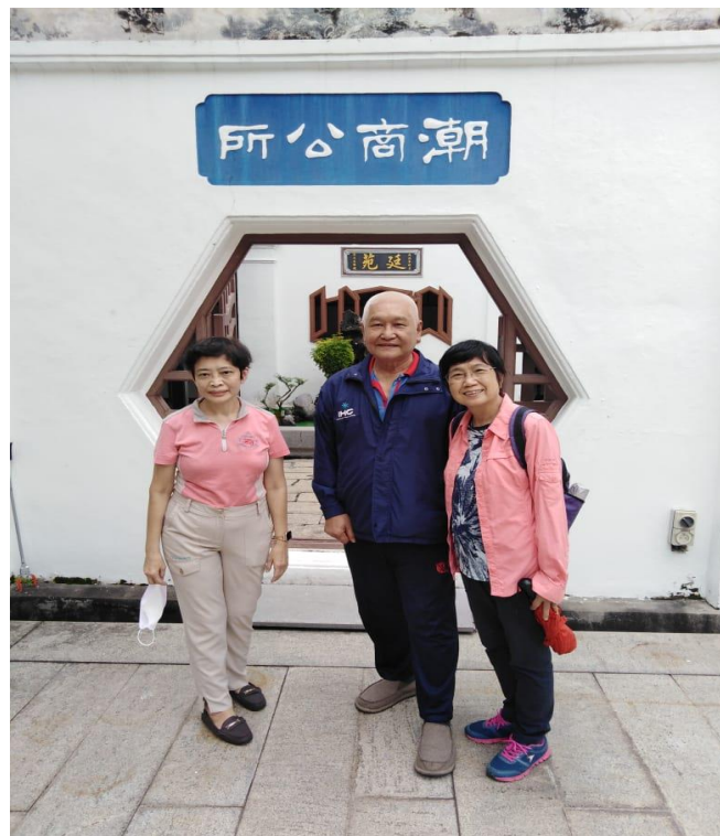
图片十：“潮商公会”