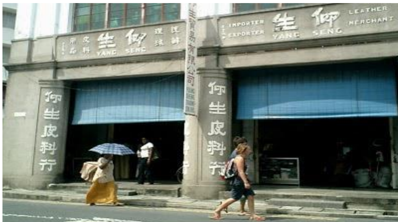
图片六之一：仰生皮料行，蔡长璜摄影 63