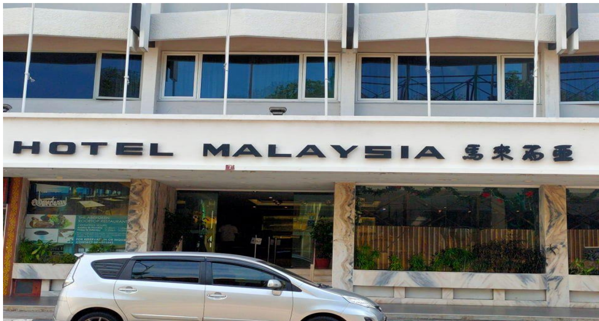
图片十四：“马来西亚”

图片十三“树胶公会”之笔意亦取法《北齐泰山经石峪金刚经》，用笔圆润厚重，雄浑朴茂。