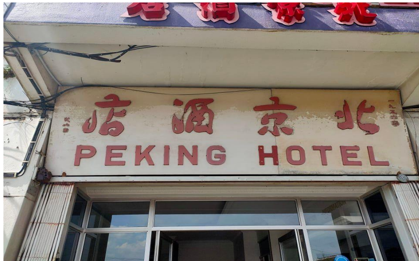
图片二十二：“北京酒店”

图片二十二“北京酒店”四字充满了隶体兼容章草的笔意，呈现出了崔大地动态的隶书笔意。