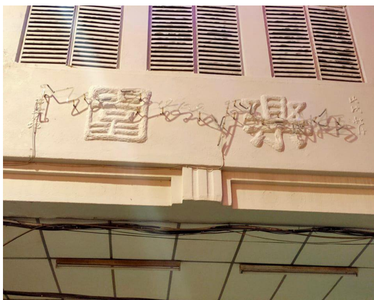
图片十一：“乐园”

图九的“槟华商业联合会”、图十的“潮商公会”及图片十一的“乐园”可见出崔大地应师法东晋的《好大王碑》的隶篆之间的运笔，它们呈现出崔大地朴厚古茂、均匀遒健、雄壮浑厚的书写特点。