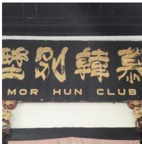
图片二十“慕韩别墅”

图片二十的“慕韩别墅”四字变化自《爨宝子碑》并加入飞白的笔法，展现出崔大地灵动的笔势。笔者以为它是崔大地的章草书法的代表作之一。