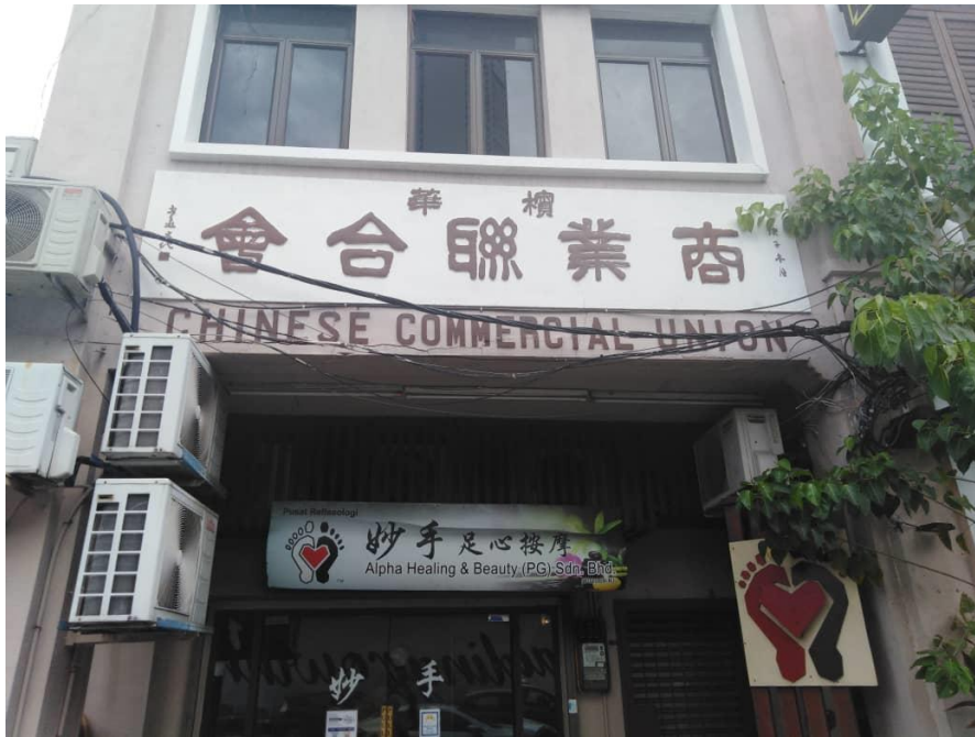
图片九：“槟华商业联合会”