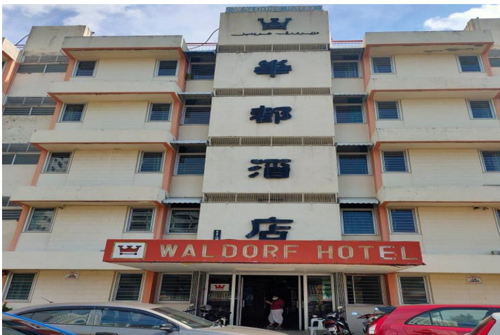
图片十五：“华都酒店”