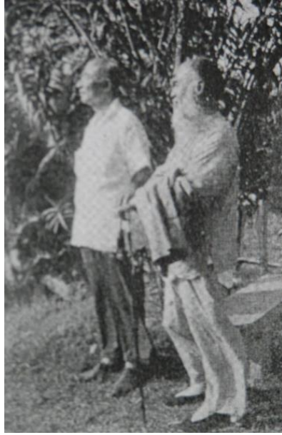
图片五：（左）崔大地与（右）张大千合影，崔大地新加坡门生整理，陈健诚提供

要说明的是，据笔者与王原人的访谈内容，崔大地与张大千的交游合照的地点也许是在槟城，或者在金马仑高原。 53 循此，萧遥天曾记叙张大千 1963 年 3 月从新加坡、吉隆坡往槟城旅途间游览：“月前大千先生漫游星马兼旬，很少涉足闹市，大半天时间徜徉于金马仑高原、福隆岗、咖啡山、升旗山，誉为四大胜地。” 54 是以，崔大地与张大千的合照亦可能是在金马仑高原或者槟城同行时所拍摄的。