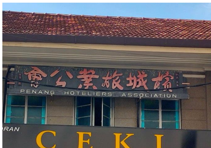
图片二十三：“槟城旅业公会”