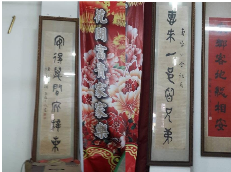
图片二十七：“惠来一邑皆兄弟，安得万间底梓桑”，李树枝摄影

图片二十七“惠来一邑皆兄弟，安得万间底梓桑”的字体为篆书体式，它们亦兼容了隶书的笔意。