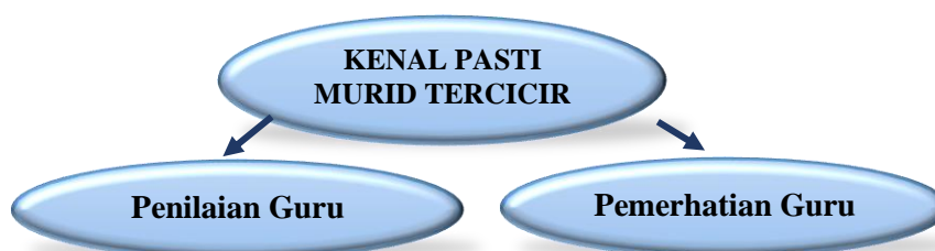
Rajah 2 menunjukkan cara guru kenal pasti murid tercicir

Dalam membincangkan tentang Pendidikan Islam, terdapat perbezaan yang jelas antara PdP Pendidikan Islam dengan mata pelajaran lain. Aspek penguasaan dan penghayatan ilmu menjadi agenda utama dalam sistem Pendidikan Islam. Amalan pengajaran GPI dimulakan dengan guru mengenal pasti murid tercicir dari aspek penilaian dan pemerhatian guru. Rajah 2 menunjukkan cara guru kenal pasti murid tercicir melalui penilaian dan pemerhatian guru dalam kajian ini.