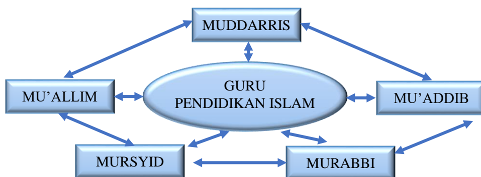
Rajah 1: Konsep Muddarris , Mu'addib , Murabbi , Mursyid dan Mu'allim

Amalan pengajaran adalah proses yang dilaksanakan oleh guru merangkumi proses perancangan, semasa dan selepas sesuatu pengajaran dan pembelajaran (PdP) di dalam kelas (Saliza, 2019). Keberkesanan dan penguasaan murid dalam PdP dipengaruhi oleh kecekapan pengajaran guru dengan membuat perancangan pengajaran yang berkesan, berpengetahuan pedagogi dan mahir menyusun strategi pengajaran (Siti Saleha, 2016). Amalan pengajaran adalah kebiasaan guru berbentuk perkataan, perbuatan, tabiat, tingkah laku atau pelaksanaan dalam pengajaran (Saliza, 2019). Dengan itu, amalan pengajaran guru dalam mata pelajaran Pendidikan Islam hendaklah bersumberkan teori amalan pengajaran guru Imam al-Ghazali yang menekankan konsep 5M iaitu Muddarris , Mu'addib , Murabbi , Mursyid dan Mu'allim . Rajah 1 menunjukkan konsep 5M.